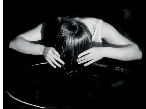
8) Filmstill aus „Spiegel“, 1973/74