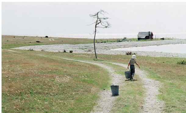
15) Filmstill aus „Opfer“, 1985/86