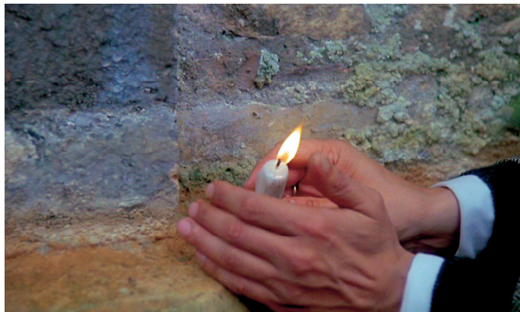
13) Filmstill aus „Nostalgia“, 1982/83