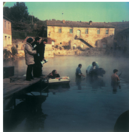
14) Am Set von Nostalgia , Bagno Vignoni, 6. November 1982