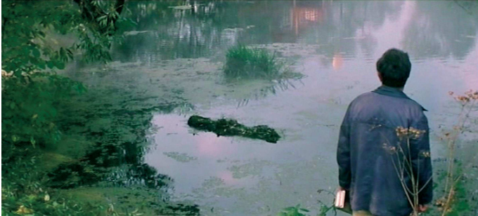
5) Filmstill aus „Solaris“, 1971/72