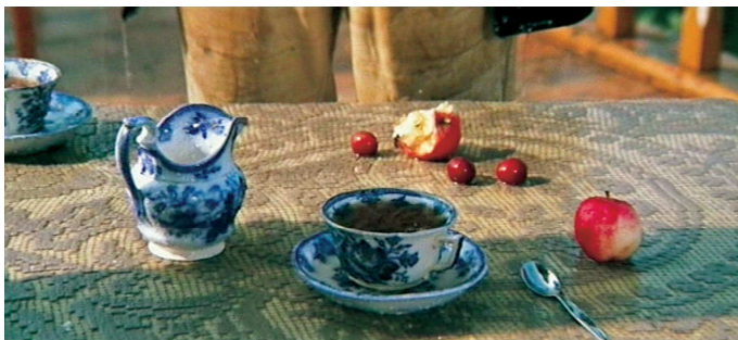
6) Filmstill aus „Solaris“, 1971/72