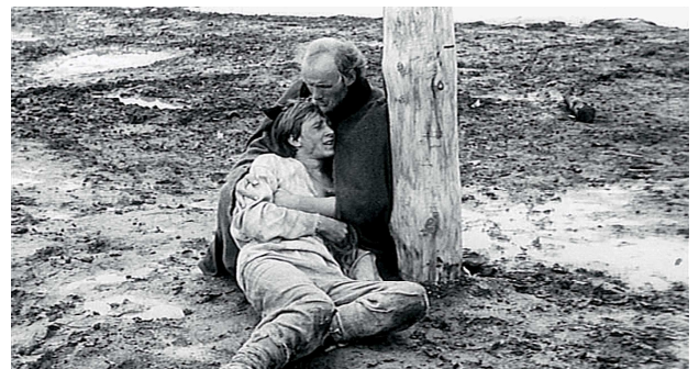
4) Filmstill aus „Andrej Rubljov“, 1964/66