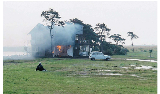
16) Filmstill aus „Opfer“, 1985/86