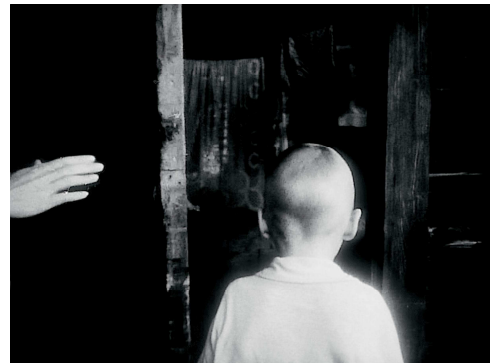
9) Filmstill aus „Spiegel“, 1973/74