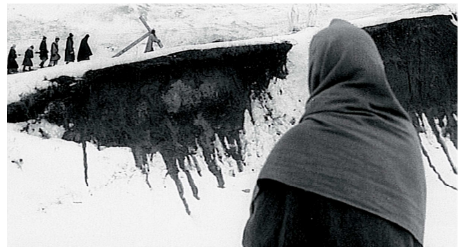
2) Filmstill aus „Andrej Rubljov“, 1964/66