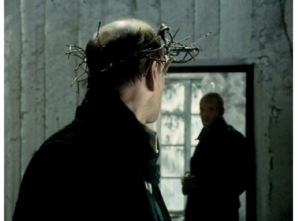
12) Filmstill aus „Stalker“, 1978/79