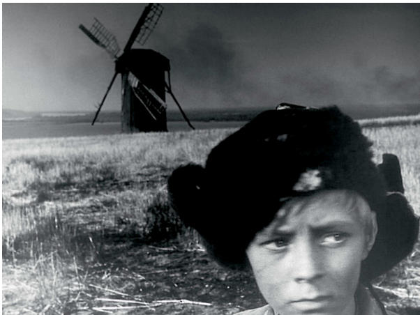
1) Filmstill aus „Ivans Kindheit“, 1962