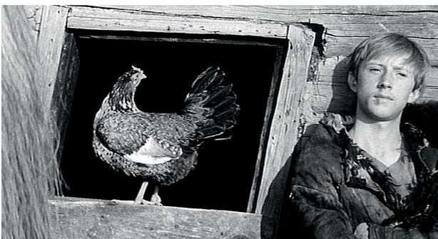
3) Filmstill aus „Andrej Rubljov“, 1964/66