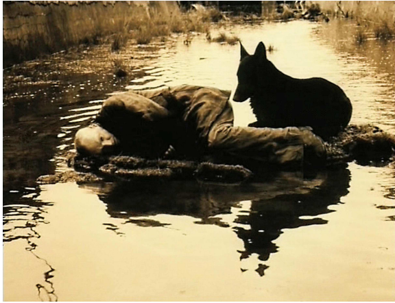
11) Filmstill aus „Stalker“, 1978/79