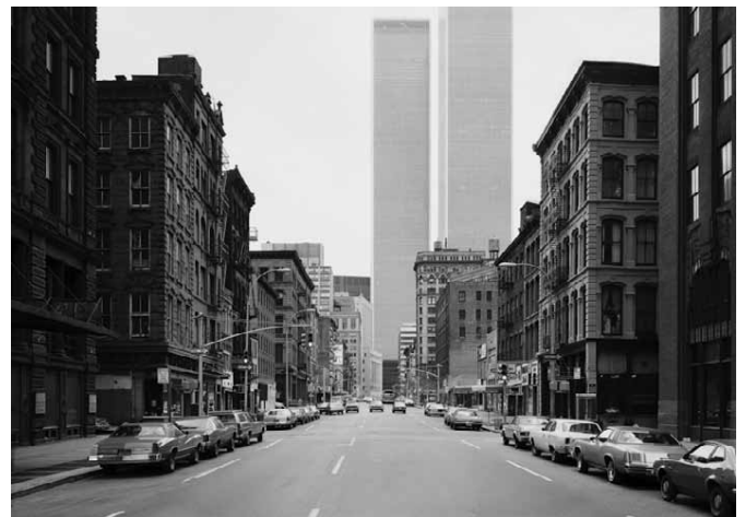
2) West Broadway, New York, 1978