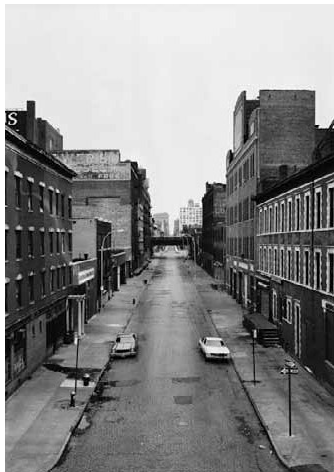
7) 21st Street, New York, 1978