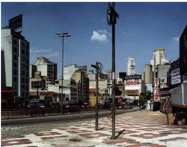
1) Avenida Tiradentes, Sao Paulo, 2001

Mit einem Text von Richard Sennett einem Nachwort des Photographen 264 Seiten, 228 Tafeln in Farbe und Duotone ISBN 978-3-8296-0618-9 Deutsche/Englische Studienausgabe Ladenpreis € 29,80, (Ö) € 30,70, CHF 34,30