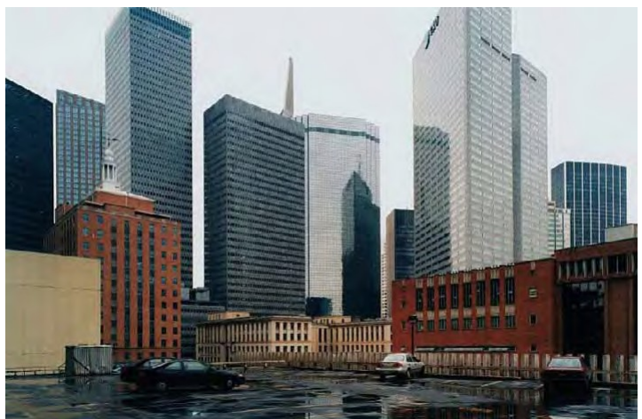
8) Dallas, Parking Lot, 2001