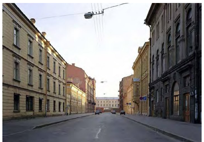
4) Počtamskaja ulica, St. Petersburg, 2005