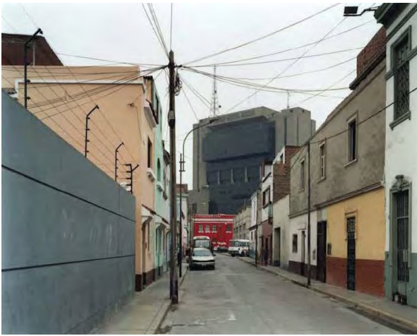
5) Pasaje Gaspar, Lima, 2003