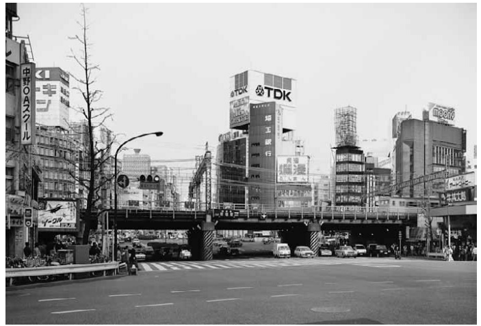
6) Shinjuku-Ku, Tokyo, 1986