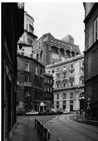
3) Via Vanella Gaetani, Neapel, 1988