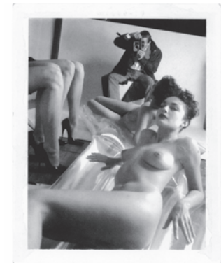
6.) Modelling fashion for Vogue Hommes with some of my favourite girls of those days, Vogue Studio, Paris, 1981 (Selbstportrait im Spiegel)