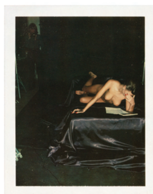
5.) Gunilla Bergström, girl with a wonderful body. Spiegel cover on women writers, 1976