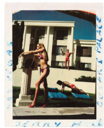
3.) Jerry Hall in Caesar's Palace, Las Vegas, who knows when.