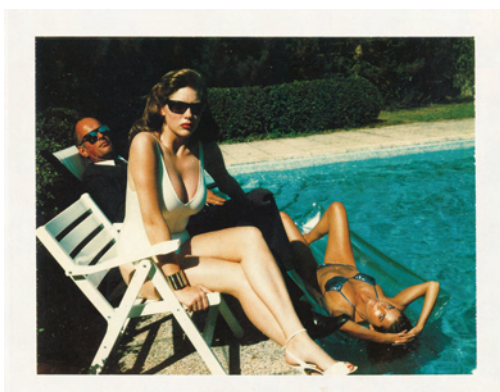
4.) 1970s - can't remember more.