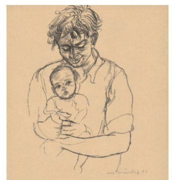
15.) Lea Grundig, Junger Mann mit Kleinkind auf dem Schoß , 1943