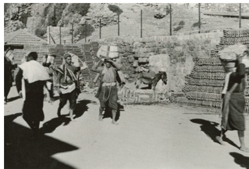
2.) Ellen Auerbach, ohne Titel [Araber mit Fässern und Kisten], 1933-1936