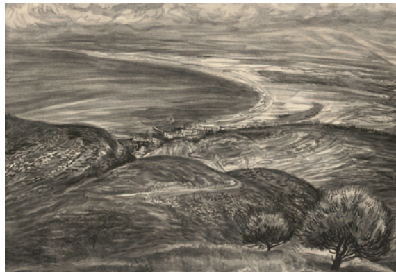
10.) Lea Grundig, Blick auf Haifa mit dem Mittelmeer , 1948