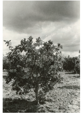
8.) Ellen Auerbach, ohne Titel [Orangenbaum], 1934