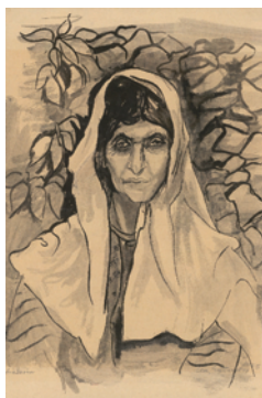
13.) Lea Grundig, Araberin , 1945