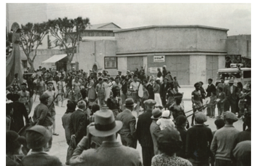
3.) Ellen Auerbach, ohne Titel [Purimfest, Festumzug], 1934