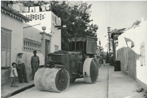
6.) Ellen Auerbach, ohne Titel [Straßenbau in Tel Aviv], 1934-1936