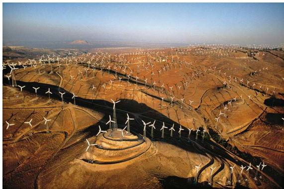
Alex MacLean: Tehachapi-Rass, Kalifornien

Für weitere Informationen und bei Fragen wenden Sie sich bitte an unsere Presseabteilung, Frau Ulrike Westphal, unter press@schirmer-mosel.com oder telefonisch unter 089-212 670 0.