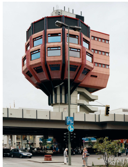
Gerrit Engel Turmrestaurant Steglitz „Bierpinsel“, 1976

Bilder eines Traums, in denen die Häuser wirken wie Boten einer fernen Welt (FAZ)