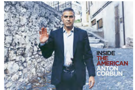
Anton Corbijn Inside the American ISBN 978-3-8296-0476-5 € 49.80, €(A) 51.20, sFr. 82.-