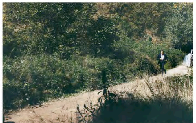
George is sunning in the bearing sun in order to prepare for natural sweaty look for the end scene.