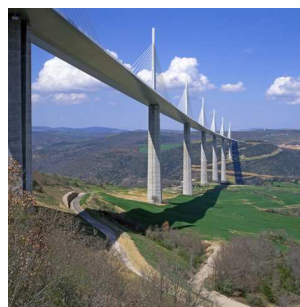
8) Viadukt von Millau, Frankreich