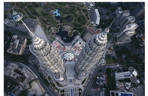
6) Petronas Towers, Malaysia