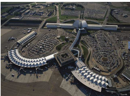
4) TGV-Bahnhof Satolas, Frankreich