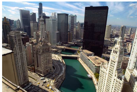
2) IBM Building, Vereinigte Staaten