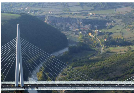
7) Viadukt von Millau, Frankreich