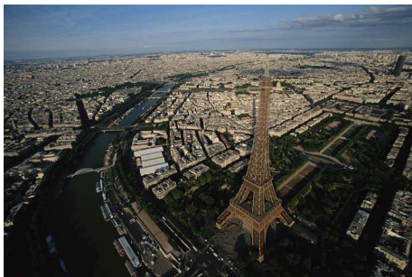
1) La Tour Eiffel, Frankreich