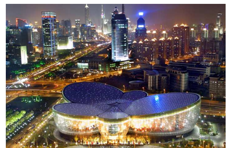
9) Oriental Art Center, China