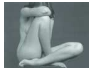
6) Nude, 1934