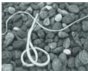
8) Dry Kelp, Point Lobos, 1934