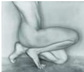
1) Nude, 1927