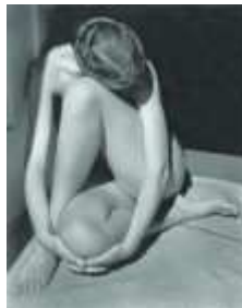
5) Nude, 1936