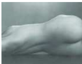
7) Nude, 1925