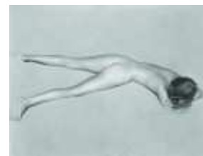
9) Nude, 1936