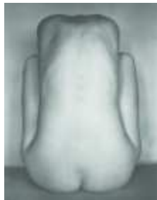
2) Nude, 1925