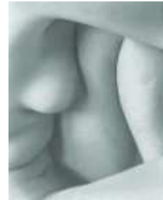
3) Nude, 1935