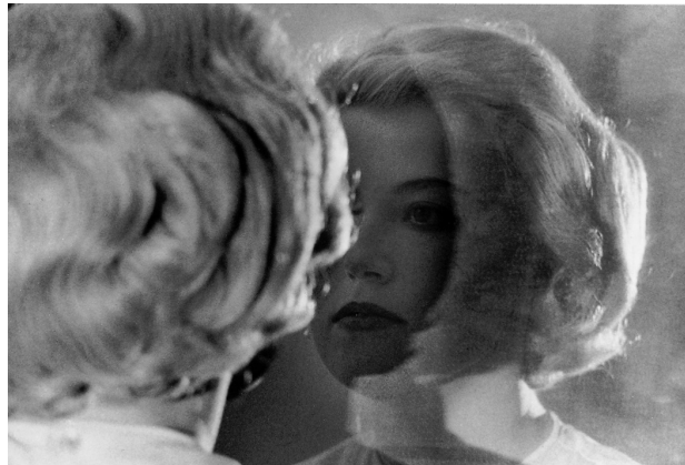
2) Untitled Film Still #56 (1980)