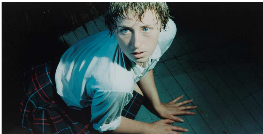
3) Untitled #92 (1981)