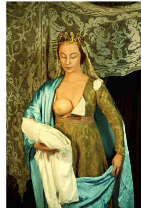
4) Untitled #216 (1989)