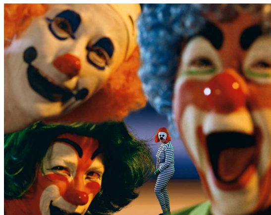
6) Untitled #425 (2004)