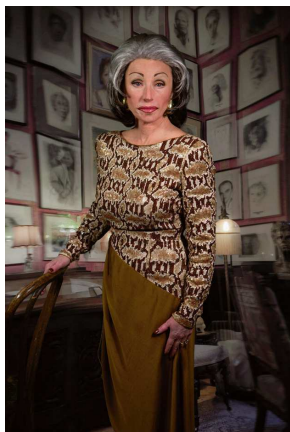
5) Untitled #474 (2008)