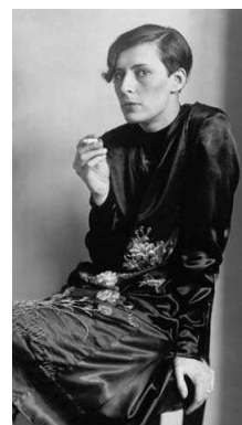
8) Sekretärin beim WDR in Köln, 1931