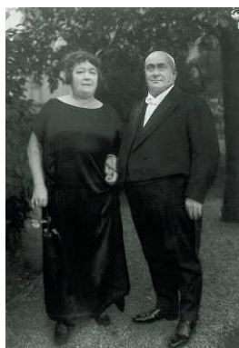
3) Herrenbauer, 1924