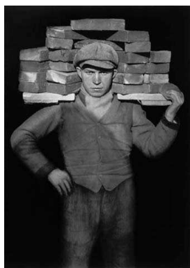
6) Handlanger, 1928