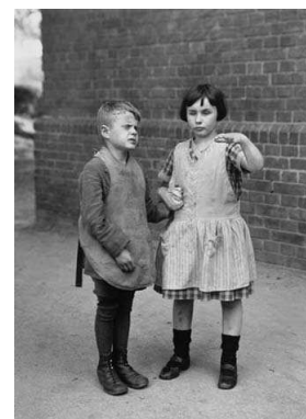
13) Blindgeborene Kinder, um 1930