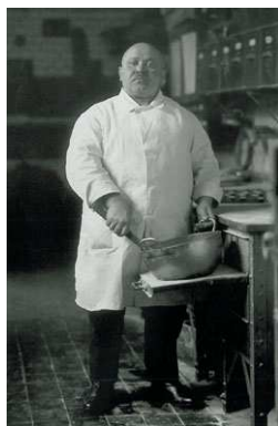
7) Konditor, 1928