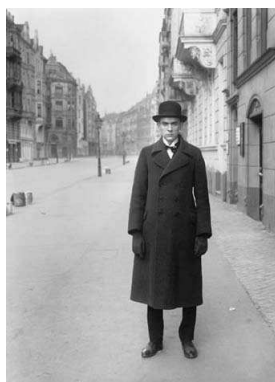
11) Maler, 1926