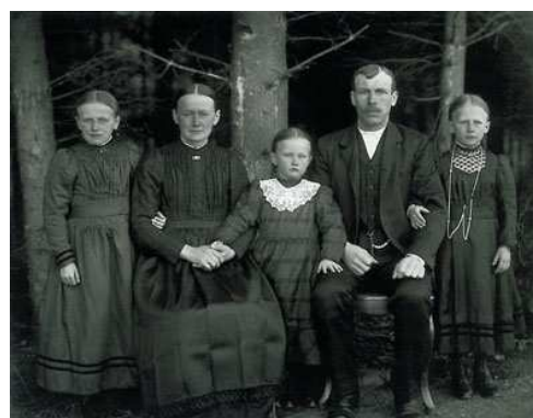
4) Bauernfamilie, 1913