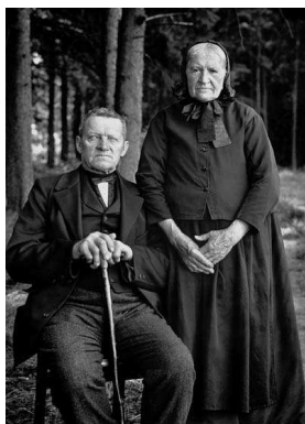
1) Bauernpaar – Zucht und Harmonie, 1912