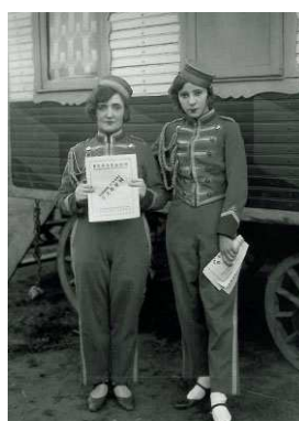
12) Platzanweiserinnen, 1926-1932