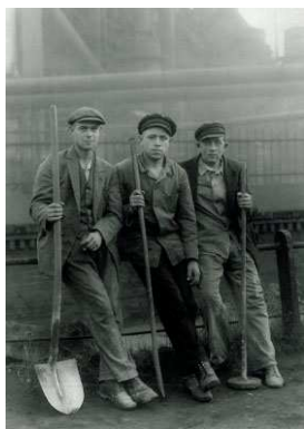
5) Straßenarbeiter im Ruhrgebiet, um 1928