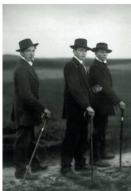
2) Jungbauern, 1914