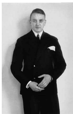
10) Der junge Kaufmann, 1927