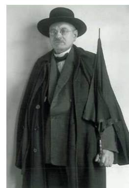
9) Abgeordneter (Demokrat), 1927