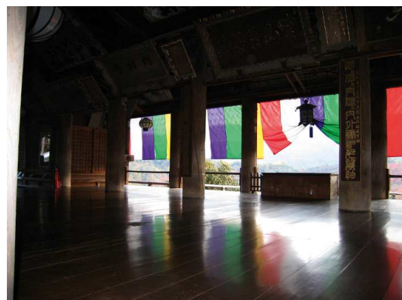
10) HASE-DERA hondō, die Haupthalle