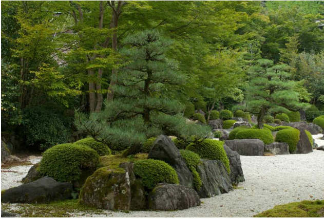
5) MIMUROTO-JI karesansui, der Trockengarten im Mimuroto-ji