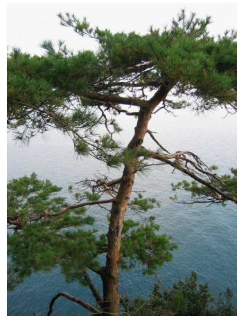
8) HÖGON-JI Aussicht vom Tempel auf den Biwa-See