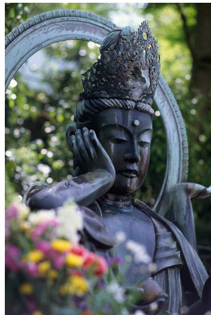
7) KIMII-DERA Statue der Nyoirin Kannon