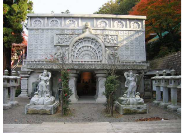
6) TSUBOSAKA-DERA TSUBOSAKA-DERA Der »Triumphbogen«, davor die beiden Tempelwächter