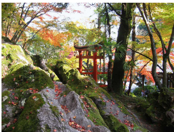
9) I SHIYAMA-DERA Tempelgarten mit dem Tor zu einem der kleinen Tempel