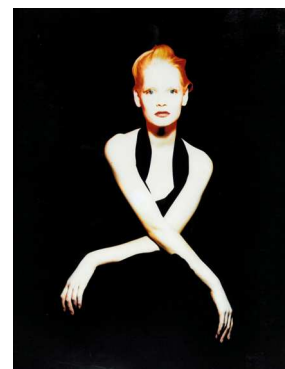
10) Kirsten Owen für Yohji Yamamoto, Paris 1987