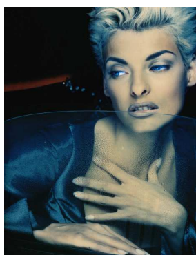
2) Linda Evangelista für Jil Sander, London 1993