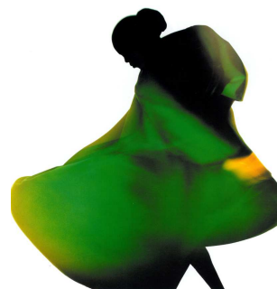
6) Green coat, Naomi Campbell für Yohji Yamamoto, Paris 1987