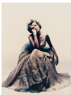
1) Tatjana Patitz für Jil Sander, Paris 1992

Die Photographien von Nick Knight Mit einem Text von Satoko Nakahara 162 Seiten, 121 Farb- und Duotone-Tafeln Format: 26,5 x 34,3 cm, gebunden Deutsch/Englisch ISBN 978-3-88814-661-9 Ladenpreis € 88,- ; sFr 141,-