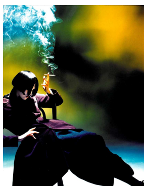
7) Susi Bick für Yohji Yamamoto, Paris 1988