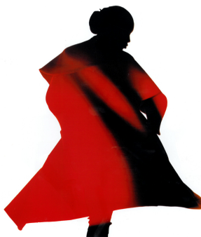
5) Red coat, Naomi Campbell für Yohji Yamamoto, Paris 1987