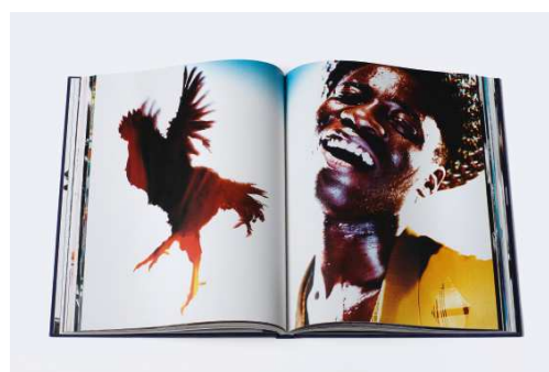
3) Doppelseite aus NICKNIGHT mit Photographien für Yohji Yamamoto, Paris 1987