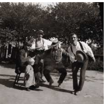
7 Vier Straßenmusikanten und ein Kleinkind, St. Louis, 1900