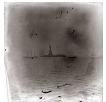
9 Blick vom auslaufenden Schiff auf die Freiheitsstatue, New York, 1900