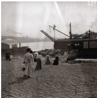
4 Auf dem Weg zum Ausflugsdampfer auf dem Mississippi, St. Louis 1900