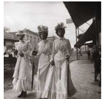
6 Drei Negerinnen im Sonnenstaat, Marshall, Texas, 1899/1900