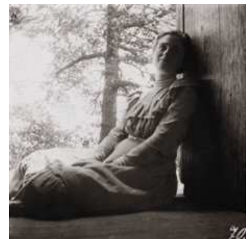
3 Junge Frau, in einem Türrahmen sitzend, Marshall, Texas, 1899/1900