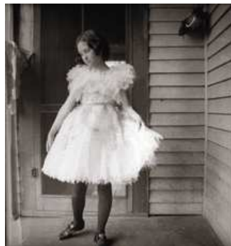
5 Mädchen in einem weißen Kleid auf einer Veranda, Marshall, Texas, 1899/1900