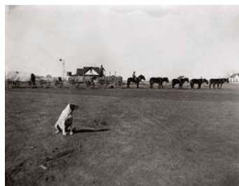
8 „Texas Frt. House“. Pferdetrack mit Hund im Vordergrund, Plainview, Texas, 1899