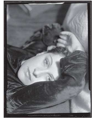
4) Dora Maar, 1936