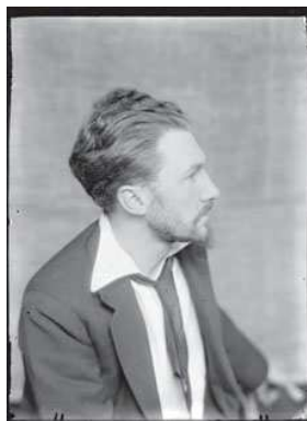
5) Ezra Pound, 1923