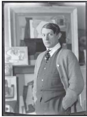
2) Pablo Picasso, um 1921