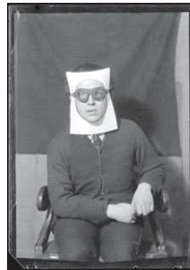
7) André Breton, um 1924