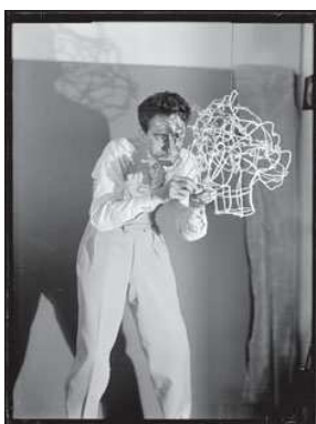
10) Jean Cocteau, um 1925