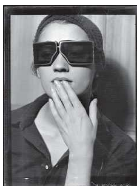
11) Lee Miller, um 1929