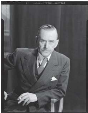
1) Thomas Mann, um 1942