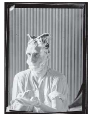
12) Marcel Duchamp, 1921