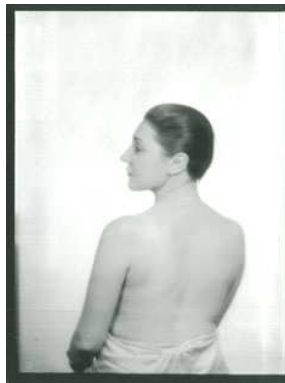
6) Youki Desnos, 1929