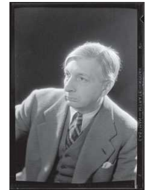
8) Giorgio de Chirico, um 1932