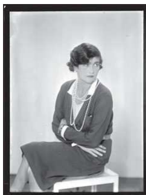
9) Coco Chanel, 1930