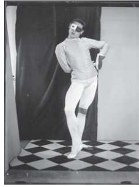
3) Serge Lifar, 1925