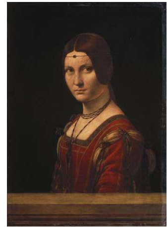
3 La belle Ferronière, um 1496