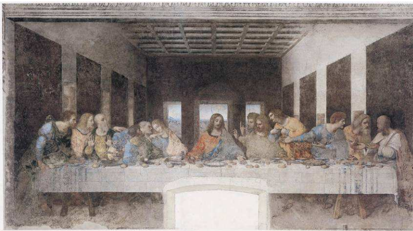
4 Abendmahl, Santa Maria delle Grazie, Mailand 1494-1498