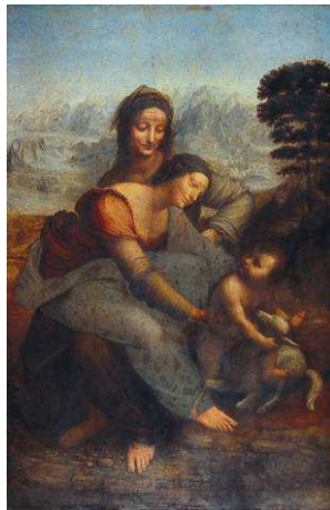
2 Hl. Anna Selbdritt, um 1510-1513