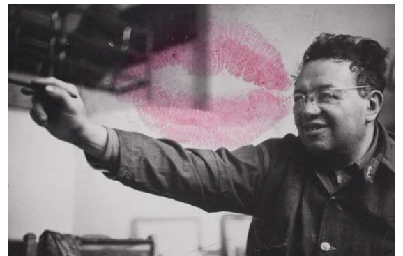
10) Diego Rivera in seinem Atelier in San Ángel, Mexiko-Stadt, ca. 1940