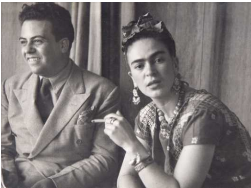
15) Miguel Covarrubias und Frida Kahlo in San Ángel, Mexiko-Stadt, 1938