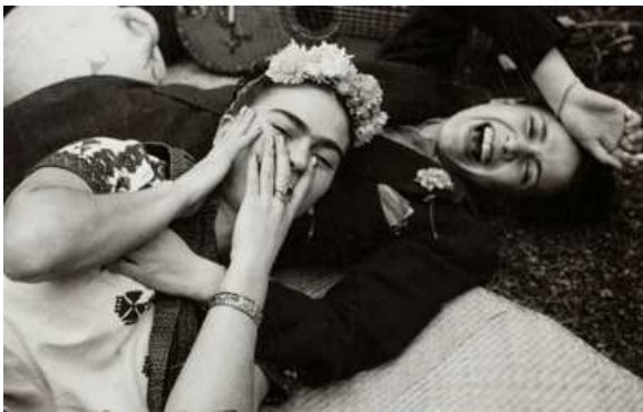
13) Frida mit einer Freundin, ca. 1945