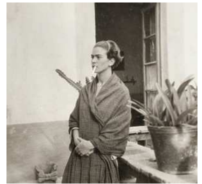
4) Frida Kahlo im Blauen Haus, 1930