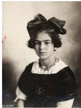
2) Frida, 15. Juni 1919, Photo: Guillermo Kahlo