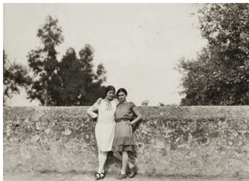
9) Tina Modotti und Frida Kahlo, ca. 1928