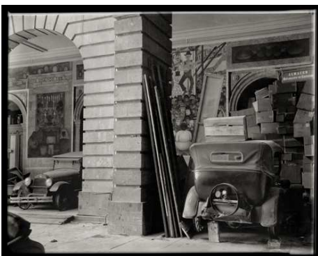
17) Korridor im Erziehungsministerium mit Diego Riveras Wandgemälde (Photo: T. Modotti)