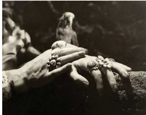
12) Fridas Hände und "Bonito", ca. 1951