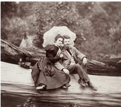
1) Matilde Calderón und Guillermo Kahlo