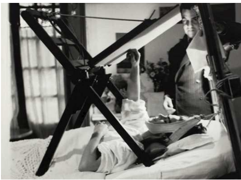
5) Frida malt in ihrem Bett, daneben Miguel Covarrubias, 1940, Mexiko-Stadt