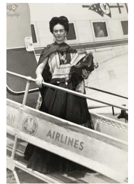
7) Frida Kahlo bei der Ankunft in New York, 1938