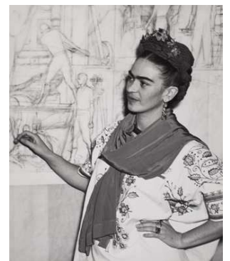
19) Frida vor Diegos Entwurf des Wandgemäldes für das San Francisco City College, 1940