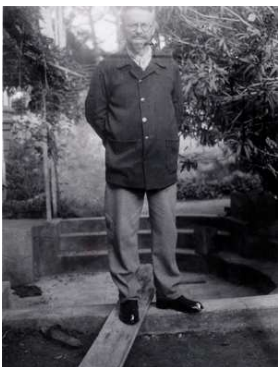
8) Leo Trotzki, Mexiko-Stadt, ca. 1938