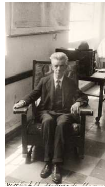
3) "Herr Kahlo nach dem Weinen", 1932