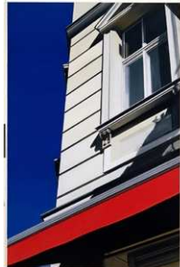
4 Sonnenschutz 1 , 2004 Öl auf Leinwand, 200 x 130 cm The Museum of Modern Art, New York Fractional and promised gift of Michael and Judy Ovitiz, 2005