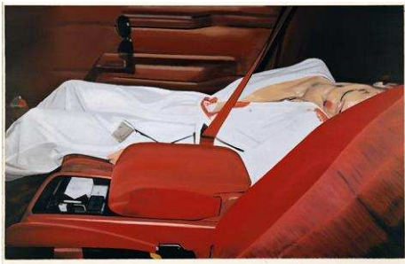
1 American Lip Gloss , 2006 Öl auf Leinwand, 150 x 150 cm Galerie Neue Meister, Staatliche Kunstsammlungen Dresden