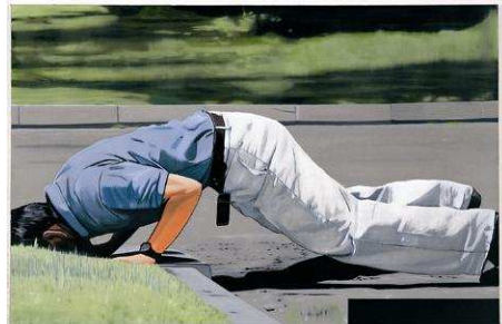
8 Security Service , 2005 Öl auf Leinwand, 105 x 160 cm Stiftung Sammlung Marx, Neue Nationalgalerie im Hamburger Bahnhof - Museum für Gegenwart, Berlin