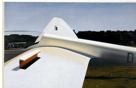
2 Stop the Panic , 2003 Öl auf Leinwand, 130 x 200 cm, ca. 39,5 x 31 cm Privatsammlung, London