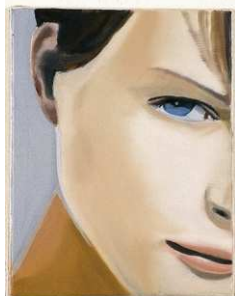
3 Cut 2 , 2003 Öl auf Leinwand, 30 x 23 cm Privatsammlung