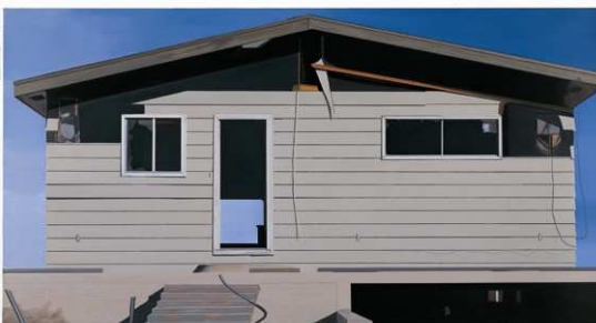
7 Superstar , 2005 Öl auf Leinwand, 160 x 300 cm Fundcao de Serralves – Contemporary Art Museum, Porto