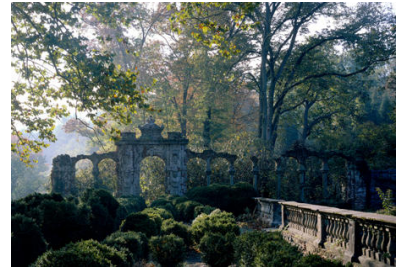
6 Eleutherian Mills, Wilmington, Delaware, 19.-20. Jh.