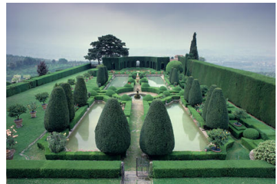
3 Villa Gamberaia, Settignano, Toskana, 17.-20. Jh.