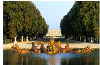
9 Versailles, Ile de France, Frankreich, 17.-18. Jh.