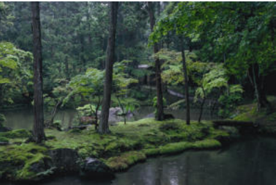
4 Saiho-ji, Kyoto, Japan, 1339