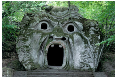
8 Villa Orsini, Bomarzo, Latium, 16. Jh.