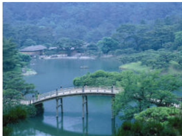
2 Ritsurin-Park, Shikoku, Japan, 17.-18. Jh.