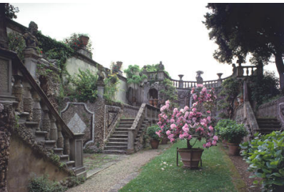
7 Villa Gamberaia, giardino segreto, Settignano, Toskana, 17. Jh.