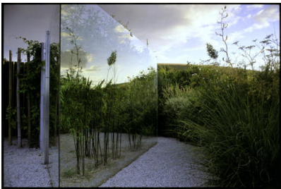
1 Garstons, Isle of Wight, Großbritannien, 1995

Penelope Hobhouse Das Paradies auf Erden finden Ein Führer zu den schönsten Gärten der Welt 288 Seiten, 200 Farbtafeln Format: 25 x 30,5 cm ISBN 3-8296-0258-8 / 978-3-8296-0258-7 Ladenpreis € 39,80 sFr 69.-