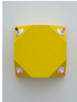
8) icon VIII (the dead nigger's icon) (to Blind Lemon Jefferson), 1962-63