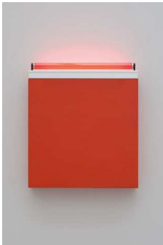
1) icon I (the heart) (to the light of Sean McGovern which blesses everyone), 1961-62