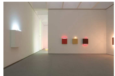
9) Installationsansicht Pinakothek der Moderne, München