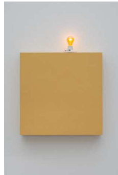
2) icon II (the mystery) (to John Reeves), 1961