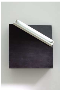
7) icon VII (via crucis), 1962-64