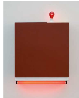
3) icon III (blood) (the blood of a martyr), 1962