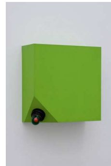
6) icon VI (Ireland dying) (to Louis Sullivan), 1962-63