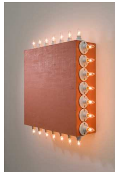
5) icon V (Coran's Broadway Flesh), 1962