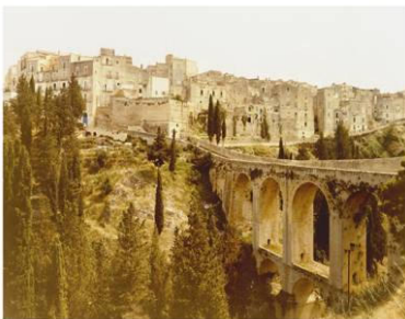
Gravina Italien, 1998