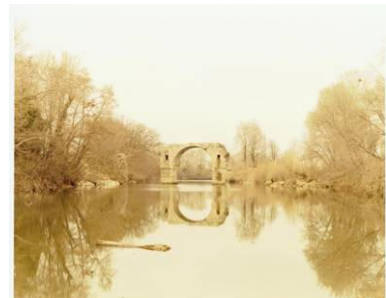
Ambrussum Frankreich, 1999