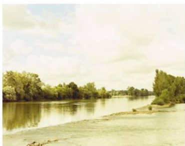
Chouze Frankreich, 1999