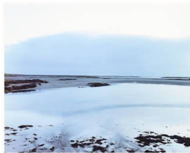
Benbecula Schottland, 1997