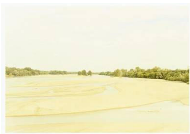
Pouilly Frankreich, 1999