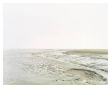
Canal des Allemands Frankreich, 1998