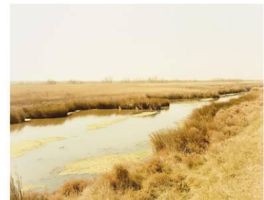
Camargue II Frankreich, 1999