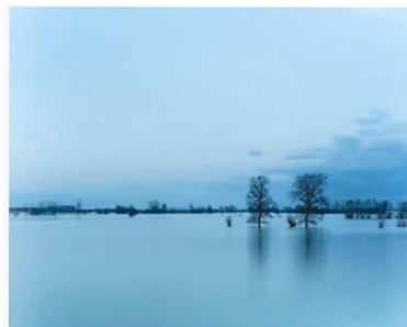
Doubt Frankreich, 1999