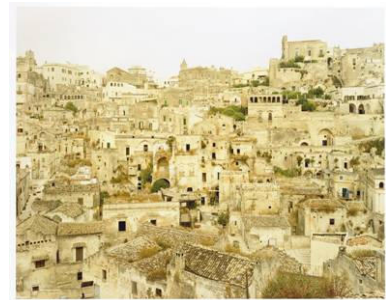
Matera I Italien, 1998