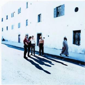
U2, Morocco 1991