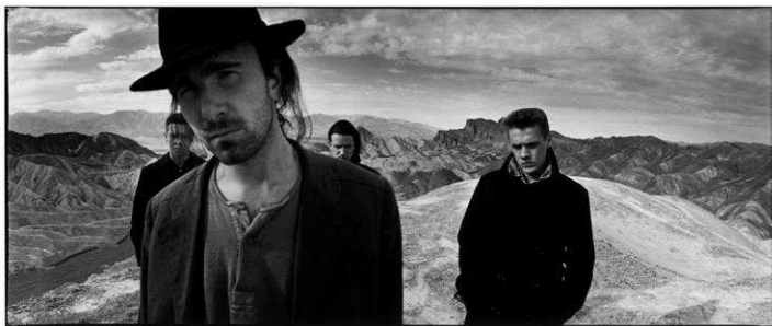
U2, Joshua Tree 1986