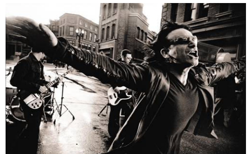
U2, Los Angeles 2001