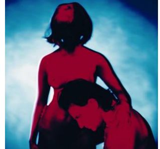
Bono, Dublin 1991