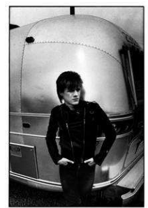
Larry Mullen Jr. Austin 1982