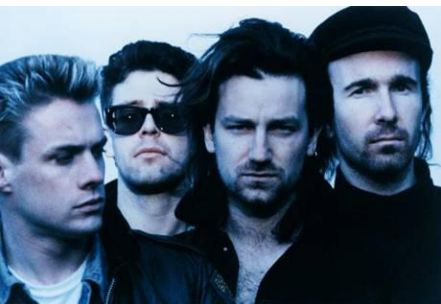
U2, London 1986