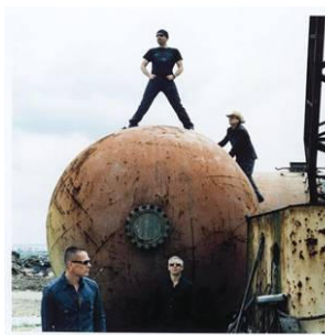
U2, Portugal 2004