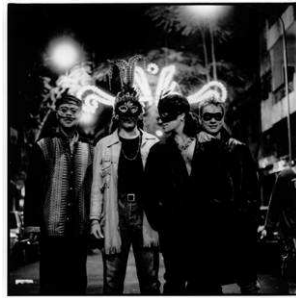
U2, Tenerife 1991