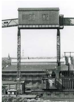
2) Bandübergabe zw. Günnigfelder Straße u. Koksofenanlage