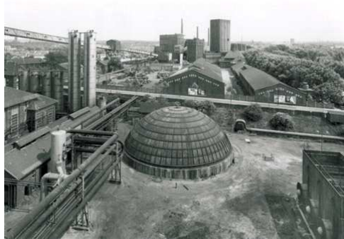
5) Nebengewinnungsanlage und Schachanlage 1/2/5 von Nordwesten