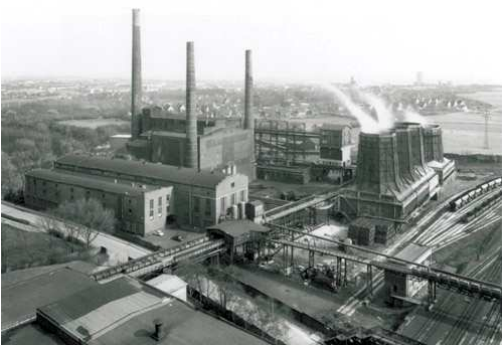
1) Kraftwerk von Nordwesten

Mit einem Text von Gabriele Conrath-Scholl 280 Seiten, 193 Duotone-Tafeln, 44 Tableaus ISBN 978-3-8296-0468-0 (Deutsch/Englisch) Ladenpreis EUR 68.-; sFr 112.-