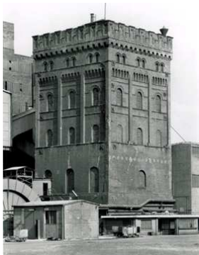
4) Malakow-Turm, Schacht 1