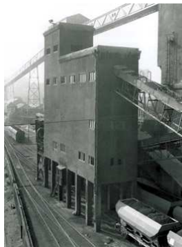
8) Verladung und Kleinkoksschieberei