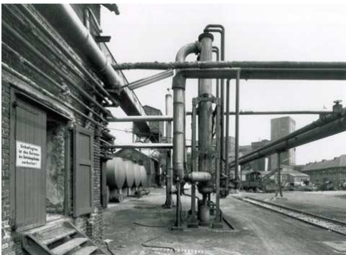
7) Ammoniakfabrik, Detail