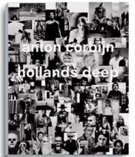
Anton Corbijn Hollands Deep

254 Seiten, 148 Tafeln ISBN 978-3-8296-0499-4 € 58.-