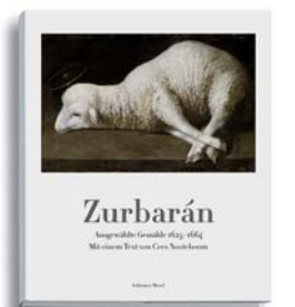
Zurbarán Ausgewählte Gemälde 1625-1664

240 Seiten, 241 Tafeln ISBN 978-3-8296-0683-7 € 49.80