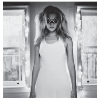
Kate Moss, New York 1996

Am Freitag, den 6. November 2015, eröffnet C/O Berlin im Amerikahaus die große Retrospektive des niederländischen Photographen und Filmregisseurs Anton Corbijn. Was in den 1970ern mit Portraits für Albumcover und Musikmagazine von U2, David Bowie oder Depeche Mode begann, ist bis heute zu einem beeindruckenden photographischen Oeuvre angewachsen: Corbijn hat mit seinen außergewöhnlichen Schwarz-Weiss-Bildern von Persönlichkeiten aus Musik, Film, Mode, Politik und Kunst nicht nur eine unvergleichliche Bildsprache kreiert, inzwischen ist er selbst eine internationale Berühmtheit. Unser Buch Anton Corbijn – Hollands Deep ist mit 241 Abbildungen das opulente Begleitbuch zur großen Schau in Berlin ( www.co-berlin.org ).