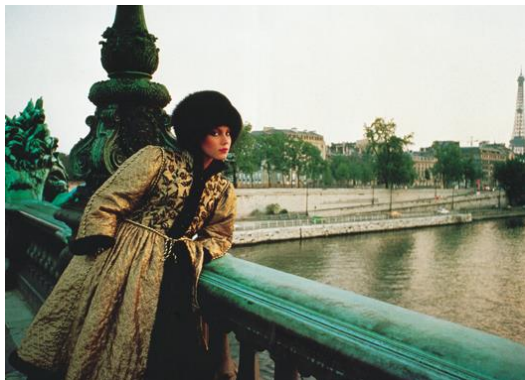
9) Herbst/Winter 1976/77