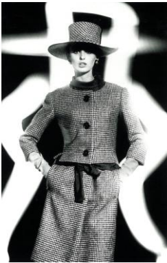
1) Aus der ersten Kollektion, 1962