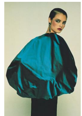
12) Herbst/Winter 1982/83