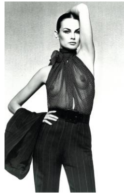
3) Nadelstreifen für die Frau, Sommer 1971, Foto: David Bailey