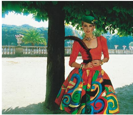
6) Herbst/Winter 1979/80, Picasso-Hommage