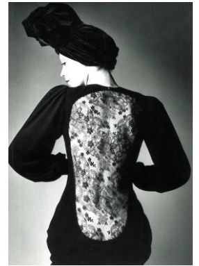
4) Herbst/Winter 1970/71