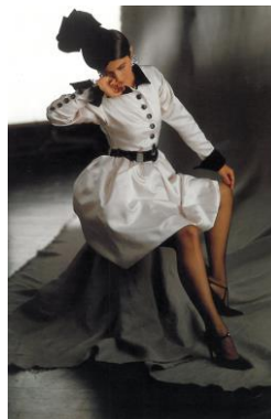
10) Herbst/Winter 1983/84