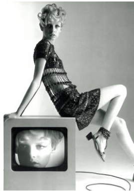
2) Afrika-Look/Sommer 1967