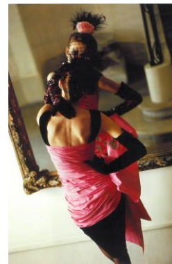
11) Herbst/Winter 1983/84