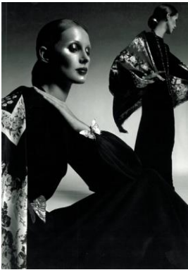
5) Herbst/Winter 1970/71