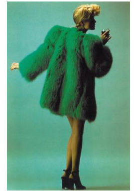
8) Sommer 1971