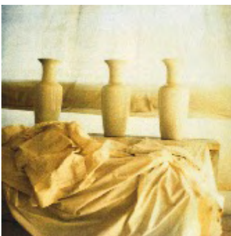
7) Bassano, 2002 Photo Cy Twombly