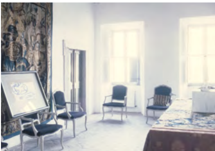
4) Bassano, 1991