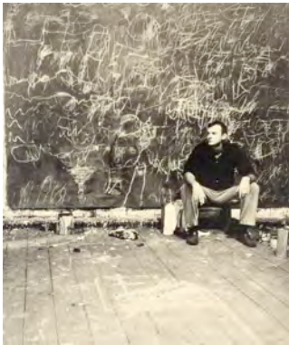
1) Fulton Street Studio, NYC, 1954 Photo Cy Twombly (or Robert Rauschenberg)

Mit Texten von Nicola Del Roscio und Florian Illies 264 Seiten, 136 Abbildungen in Farbe und Duotone Klappenbroschur ISBN 978-3-8296-0908-1 € 44,- €(Ö) 45,30 CHF 50,60