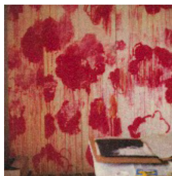
8) Gaeta, 2006 Photo Cy Twombly