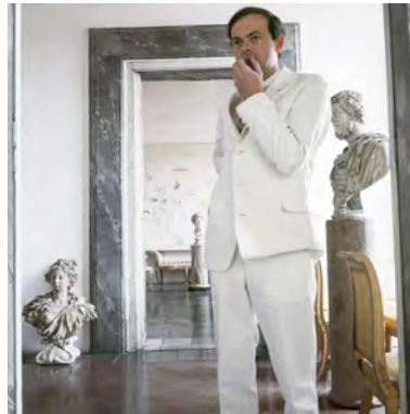
2) Via di Monserrato, Rome, 1965