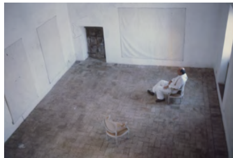
5) Bassano, 1991