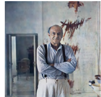
9) Gaeta, 1995