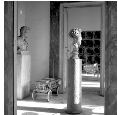
3) Via di Monserrato, Rome 1969/70