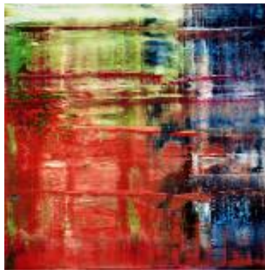
2) Bach (1), 1992 WV 785, 300 x 300 cm Moderna Museet, Stockholm