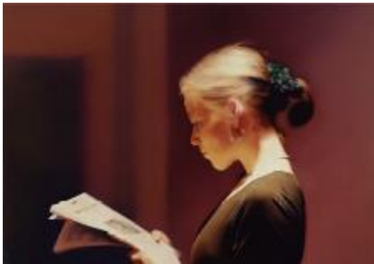
1) Lesende, 1994 WV 804, 72 x 102 cm San Francisco Museum of Modern Art

armin zweite das denken ist beim malen das malen gerhard richter – leben und werk 480 Seiten, 251 Farbtafeln. 162 Abb. ISBN 978-3-8296-0758-2 € 128,- € (Ö) 131,60 CHF 147,-