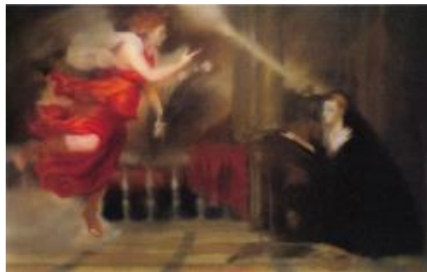
5) Verkündigung nach Tizian, 1973, WV 343/1, 125 x 200 cm Hirshhorn Museum and Sculpture Garden, Smithsonian Institution, Washington, DC