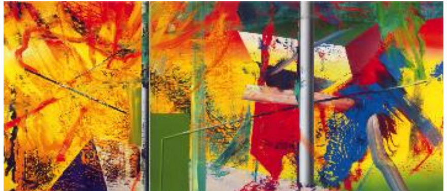
8) Atelier, 1985 (3-teilig), WV 574, 260 x 600 cm Staatliche Museen zu Berlin, Neue Nationalgalerie