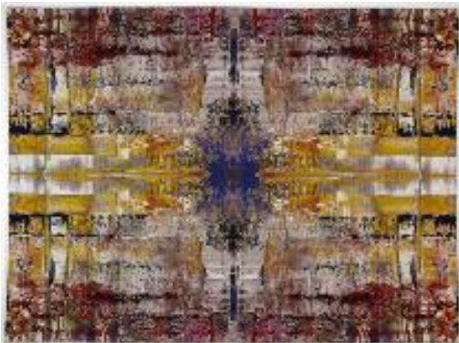
7) Abdu, 2009, Gewebter Jacquard-Wandteppich, 276 x 378 cm, Edition 144