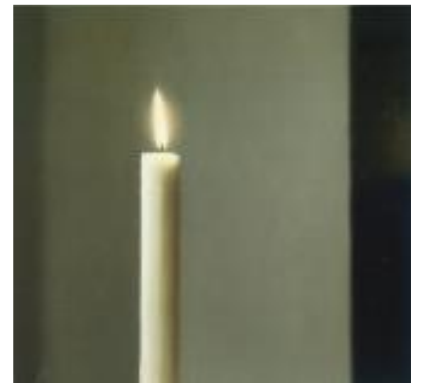
3) Kerze, 1982 WV 512/1, 90 x 95 cm Privatsammlung