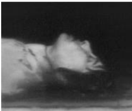
4) Tote, 1988 WV 667/1, 62 x 67 cm The Museum of Modern Art, New York