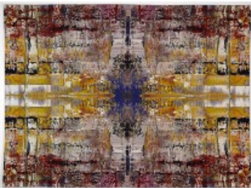
7) Abdu, 2009, Gewebter Jacquard-Wandteppich, 276 x 378 cm, Edition 144