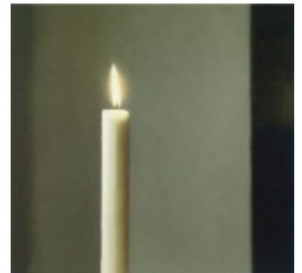
3) Kerze, 1982 WV 512/1, 90 x 95 cm Privatsammlung