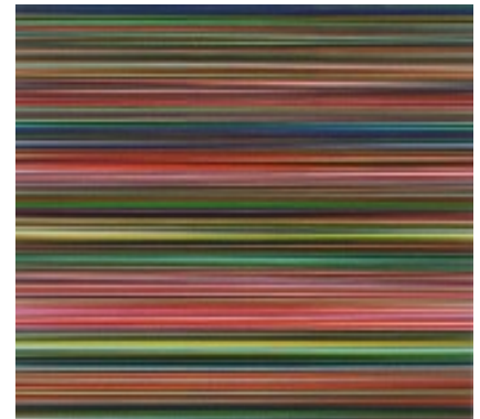
6) Strip, 2011, Digitaler Druck montiert zwischen Aluminium und Perspex