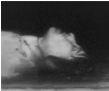
4) Tote, 1988 WV 667/1, 62 x 67 cm The Museum of Modern Art, New York