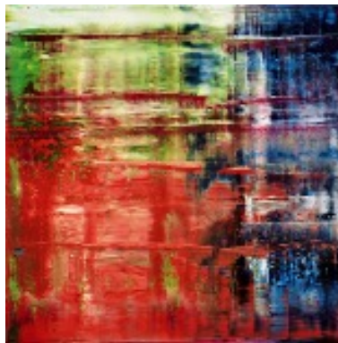
2) Bach (1), 1992 WV 785, 300 x 300 cm Moderna Museet, Stockholm