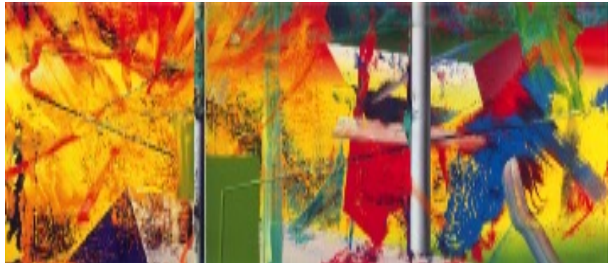
8) Atelier, 1985 (3-teilig), WV 574, 260 x 600 cm Staatliche Museen zu Berlin, Neue Nationalgalerie