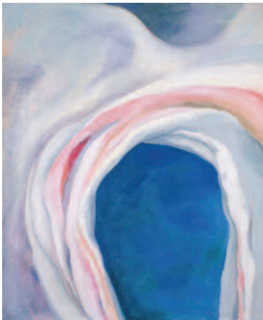
1.) Music - Pink and Blue I , 1919

Georgia O'Keeffe Gemälde Mit einem Text von Jula Dech 128 Seiten, 39 Farbtafeln ISBN 978-3-8296-1015-5 € 10,- € (Ö) 10,30 CHF 11,50