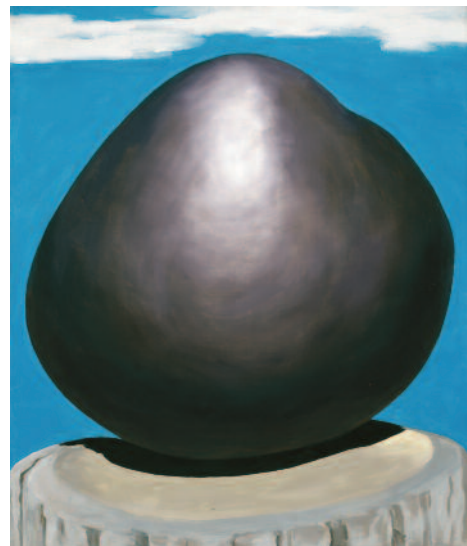
7.) Black Rock with Blue Sky and White Clouds , 1972