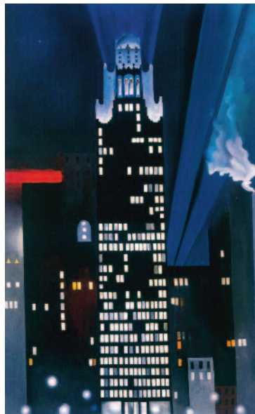
2.) Radiator Building - Night, New York 1927