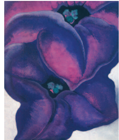
3.) Purple Petunias , 1925