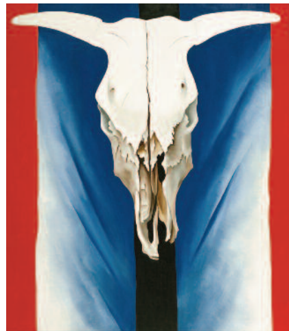
5.) Cow's Skull - Red, White, and Blue , 1931