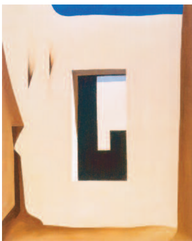
6.) In the Patio I , 1946