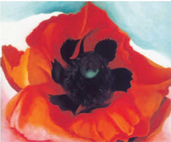
4.) Poppy , 1927

- Fortsetzung - Georgia O'Keeffe - Gemälde