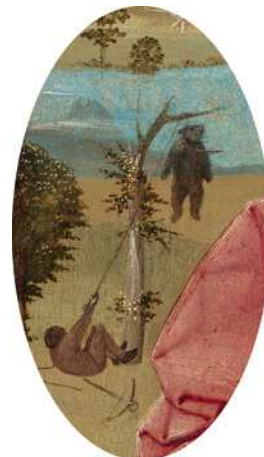
9) Detail aus Der Heilige Christophorus