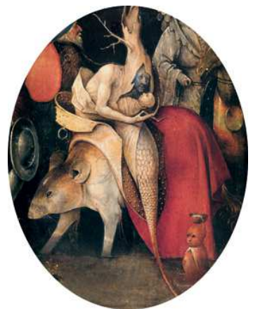
5) Detail aus Die Versuchung des Heiligen Antonius , Mitteltafel