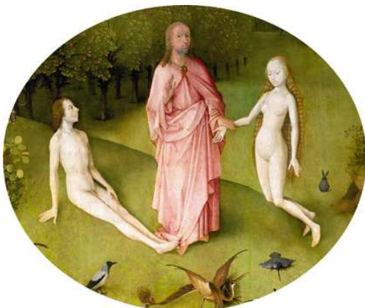
10) Detail aus Der Garten der Lüste , linke Tafel