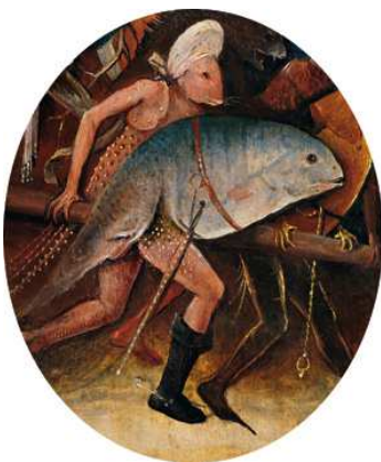
3) Detail aus Der Heimgarten , Mitteltafel