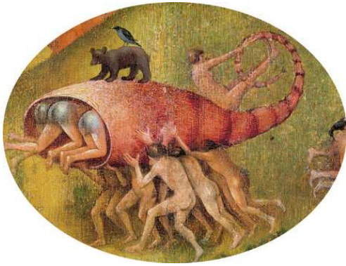
6) Detail aus Der Garten der Lüste , Mitteltafel

Cees Nooteboom: Reisen zu Hieronymus Bosch