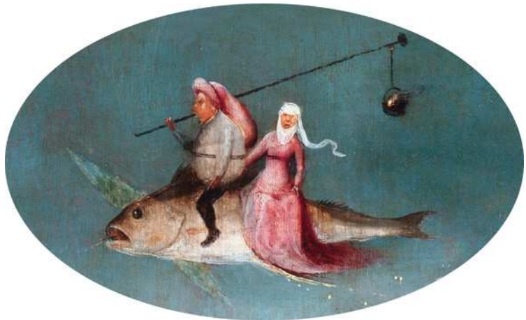
2) Detail aus Die Versuchung des Heiligen Antonius , rechte Tafel