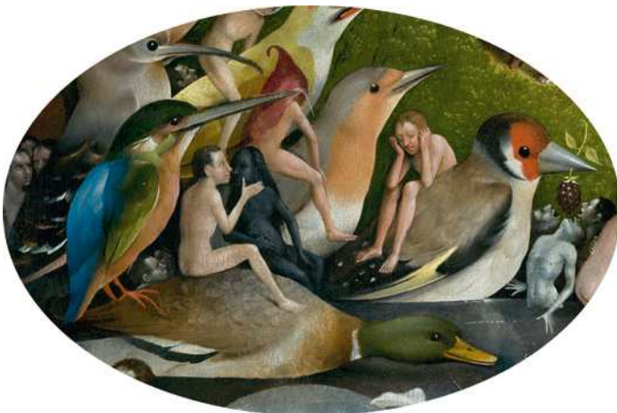
8) Detail aus Der Garten der Lüste , Mitteltafel