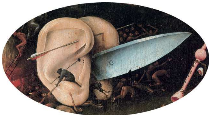
11) Detail aus Der Garten der Lüste , rechte Tafel