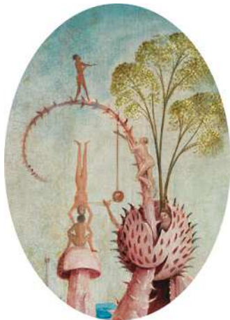
1) Detail aus Der Garten der Lüste , Mitteltafel

Cees Nooteboom Reisen zu Hieronymus Bosch Eine düstere Vorahnung 80 Seiten, 67 Farbabbildungen Gebundene Ausgabe ISBN 978-3-8296-0746-9 €29.80, (A) €30.70, CHF 34.30