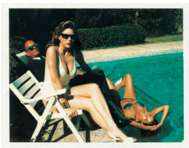
4.) 1970s – can't remember more.