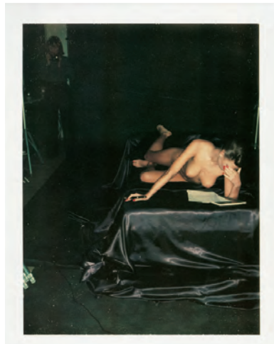
5.) Gunilla Bergström, girl with a wonderful body. Spiegel cover on women writers, 1976.