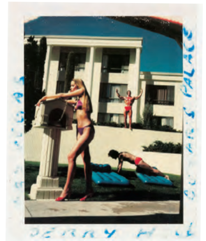
3.) Jerry Hall in Caesars Palace, Las Vegas, who knows when.