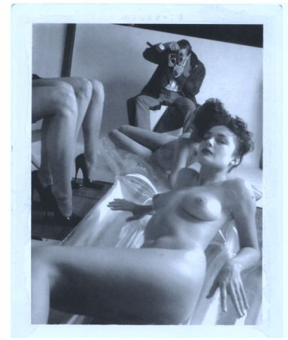
6.) Modelling fashion for Vogue Hommes with some of my favourite girls of those days, Vogue Studio, Paris , 1981. (Selbstportrait im Spiegel)