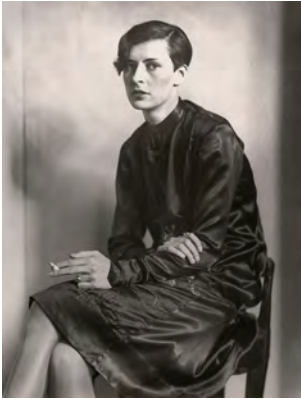
8.) Sekretärin vom Westdeutschen Rundfunk, Köln, 1931, Foto: August Sander