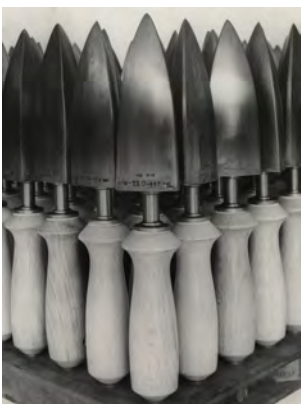
14.) Bügeleisen für Schuhfabrikation, 1928