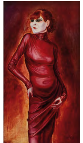
4.) Otto Dix, Bildnis der Tänzerin Anita Berber , 1925