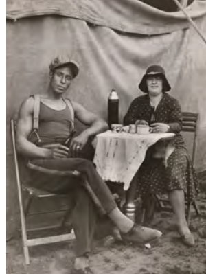
10.) Zirkusarbeiter, 1926-1932