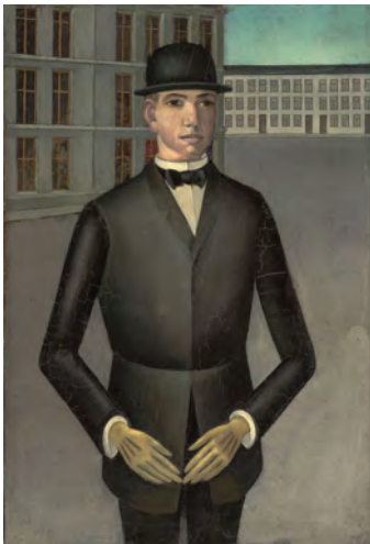
1.) Anton Räderscheidt, Junger Mann mit gelben Handschuhen , 1921