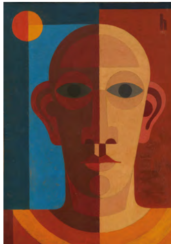
2.) Heinrich Hoerle, Selbstportrait , um 1931