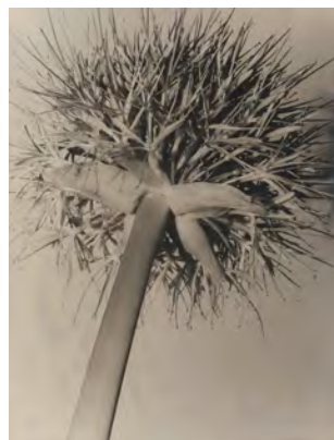
15.) Winterzwiebel, um 1926-1928