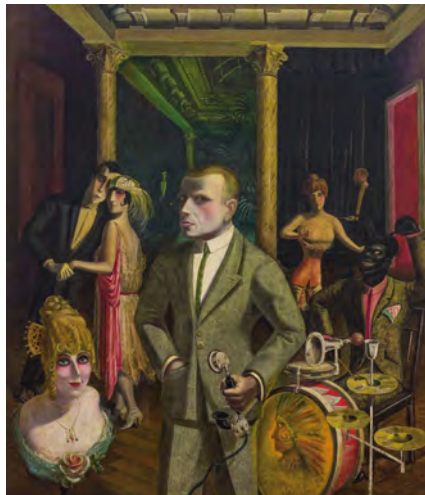
3.) Otto Dix, An die Schönheit (Selbstbildnis) , 1922