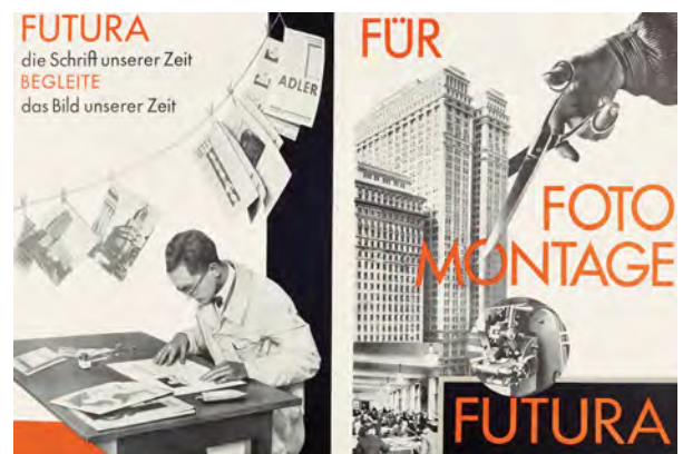
16.) »Für Fotomontage Futura« in der Zeitschrift Gebrauchsgraphik , März 1929, von Heinrich Jost