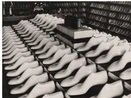
13.) Musterzimmer im Fagus-Werk Benscheidt in Alfeld, 1928