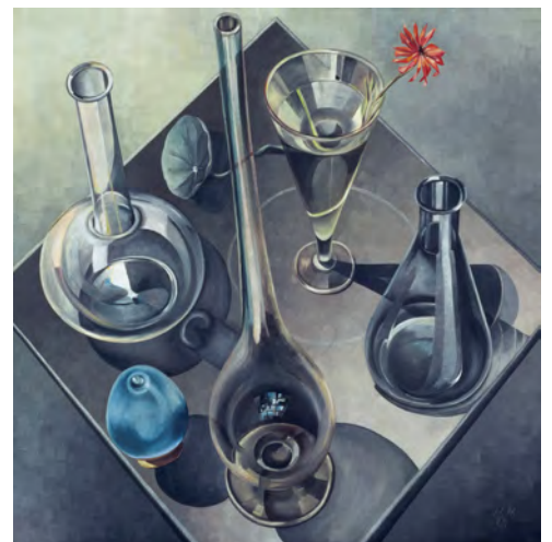
7.) Hannah Höch, Gläser , 1927