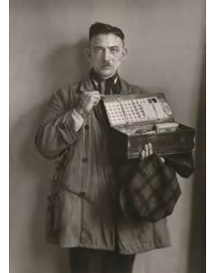
11.) Hausierer, 1930