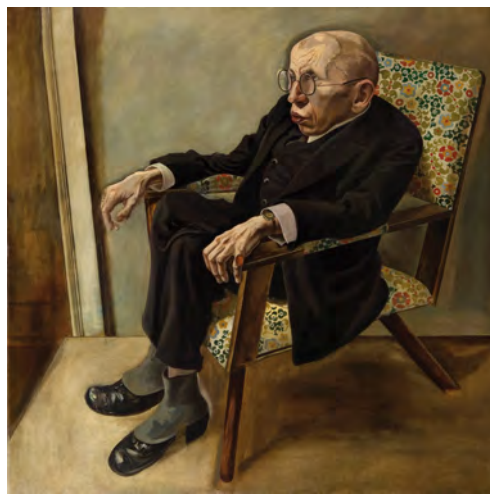
6.) George Grosz, Portrait des Schriftstellers Max Herrmann-Neiße , 1925