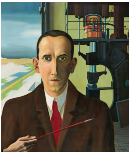
5.) Carl Grossberg, Selbstbildnis , 1928