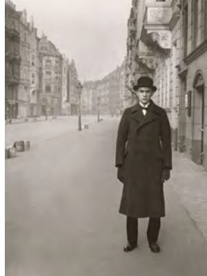
9.) Maler (Anton Räderscheidt), 1926