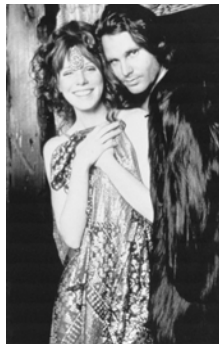
6.) Jim Morrison und Pamela Courson, 1969