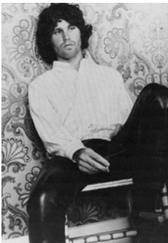
1.) Jim Morrison, 1968

Jerry Hopkins JIM MORRISON. Der König der Eidechsen Die endgültige Biographie und die großen Interviews Überarbeitete und erweiterte Ausgabe 280 Seiten, 57 Abbildungen ISBN 978-3-8296-0934-0 € 29,80 €(Ö) 30,70 CHF 34,30