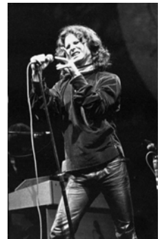
4.) Jim Morrison, Fillmore East-Konzert, März 1968, New York City