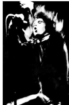
3.) Jim Morrison, Fillmore East-Konzert, März 1968, New York City