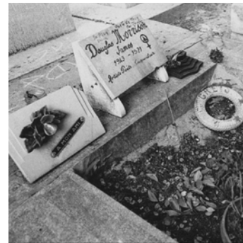
7.) Morrisons Grab auf dem Friedhof Père Lachaise in Paris