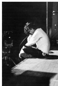
10.) Jim Morrison, Amsterdam, 1968