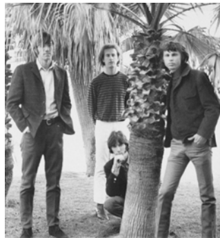
2.) Die Doors am Venice Beach, 1967