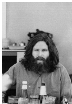
9.) Jim Morrison, Paris, 1971