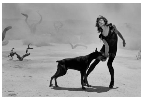
2) Milla Jovovich, Vogue Italy, Mojave Desert, California, USA, 2005.