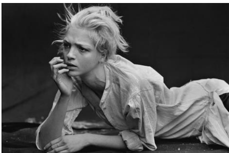
11) Mariacarla Boscono, Numero, Deauville, France, 2006.