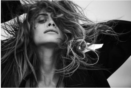
7) Elisa Sednaoui, Le Touquet, France, 2007.