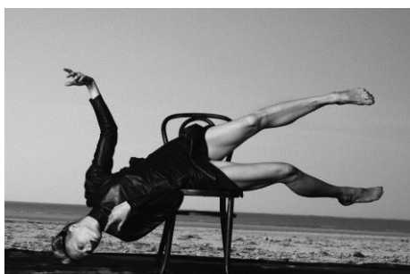
3) Kristen McMenamy, Vogue Italy, Le Touquet, France, 2009.