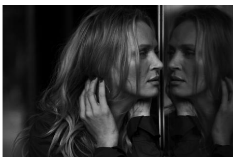
1) Uma Thurman, Vogue Italy, Downtown, Los Angeles, USA, 2011.

Ladenpreis € 49,80, €(Ö) 51,20, CHF 57,30