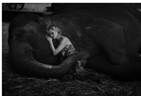
4) Reese Witherspoon, Vogue US, La Circus, Los Angeles, California, USA, 2011.