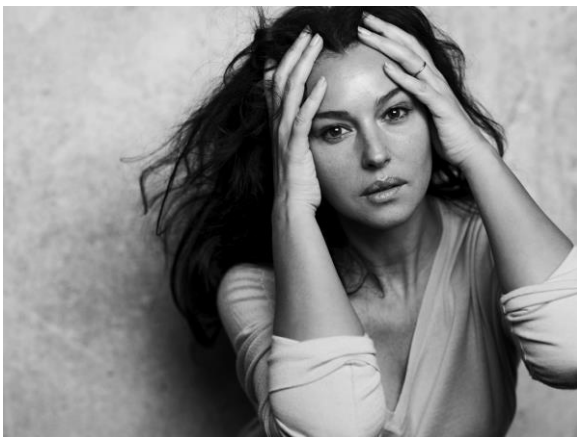
9) Monica Bellucci, Elle France, Paris, France, 2009.