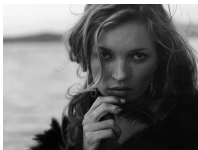
6) Kate Moss, St. Barth, 2007.

– Bitte beachten Sie die Abdruckbedingungen auf S. 3 –