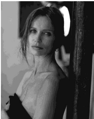
Veruschka, Vogue Italien, Pin-up Studio, Paris 1988

Ladenpreis € 49,80, (Ö) € 51,20, CHF 57.30