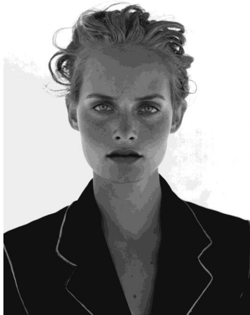
Amber Valletta, Harper's Bazaar USA, Nevada 1994