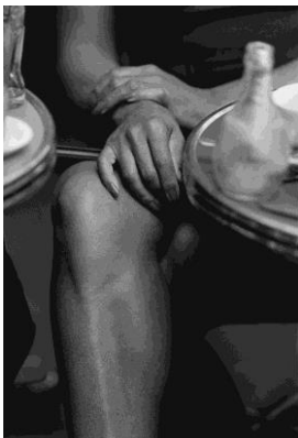
Tina Turner, Vogue Italien, Cafe de Flore, Paris 1989