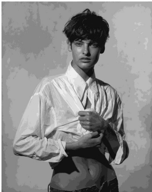
Linda Evangelista, Vogue Italia, Pin-up Studio, Paris 1988