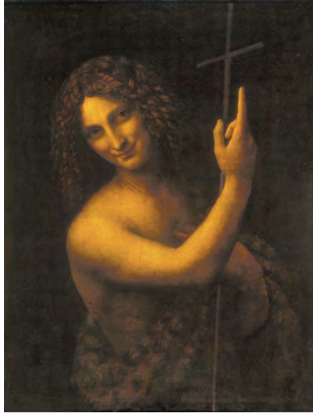
8) »Heiliger Johannes der Täufer«, zwischen 1508 und 1513. Paris, Louvre