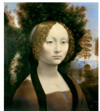
6) »Portrait Ginevra de' Benci«, um 1474. Washington, National Gallery