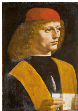
5) »Portrait eines Musikers«, um 1487. Mailand, Pinacoteca Ambrosiana