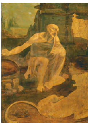
4) »Heiliger Hieronymus«, unvollendet, um 1479-1481. Rom, Pinacoteca Vaticana