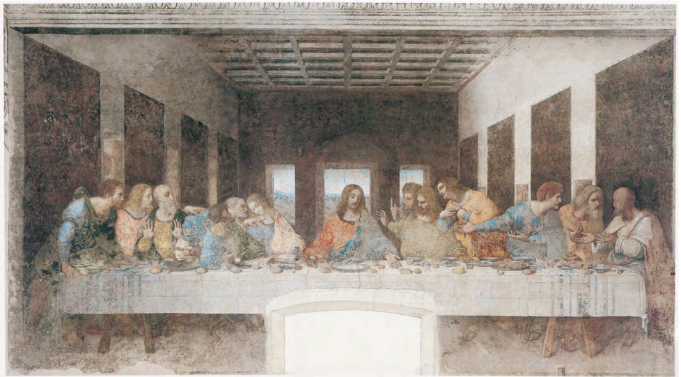
10) »Abendmahl«, 1494-1498. Mailand, Santa Maria delle Grazie, Refektorium (restaurierte Fassung)