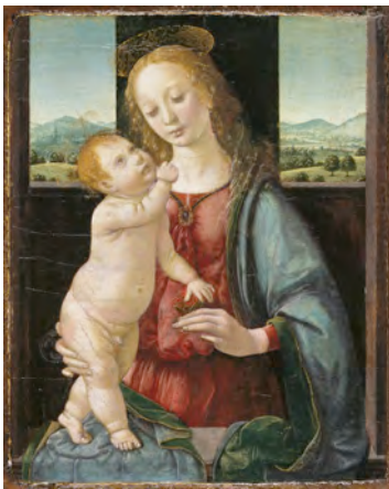
1) »Madonna Dreyfus«, um 1469-1470. Washington, National Gallery, Kress Collection