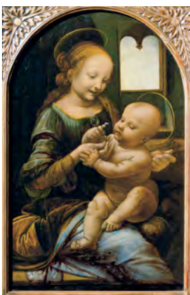
3) »Madonna Benois«, um 1478 begonnen. St. Petersburg, Eremitage