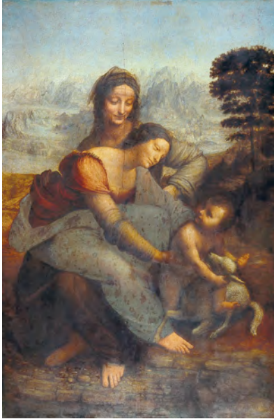
7) »Heilige Anna Selbdritt«, um 1510-1513. Paris, Louvre