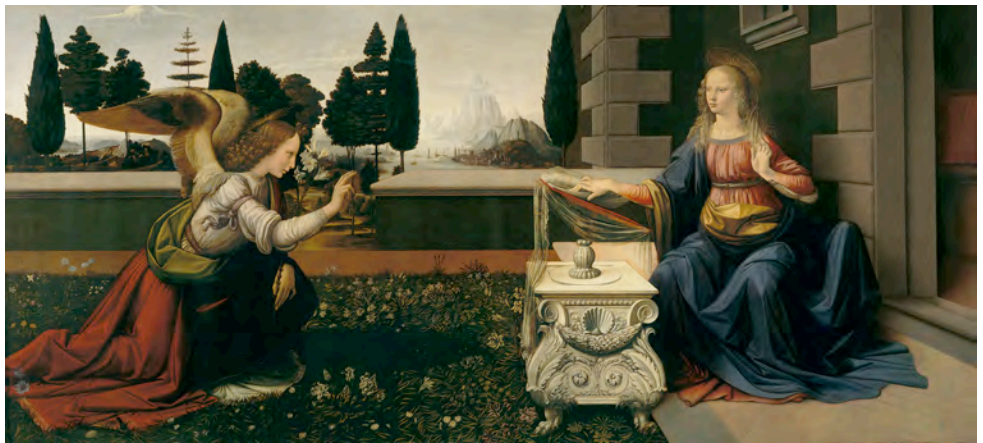
2) »Verkündigung«, 1472-1475. Florenz, Uffizien