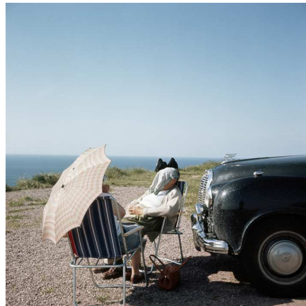
8) Bretagne, 1960 (S. 119)