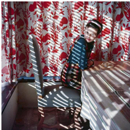
4) Florette, Vence, Mai 1954 (S. 83)