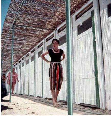
6) Florette am Strand des Carlton, Cannes, Juli 1956 (S. 85)