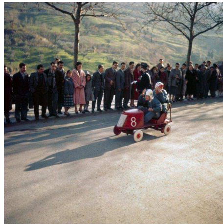
5) Ascoli Piceno, 1958 (S. 142)