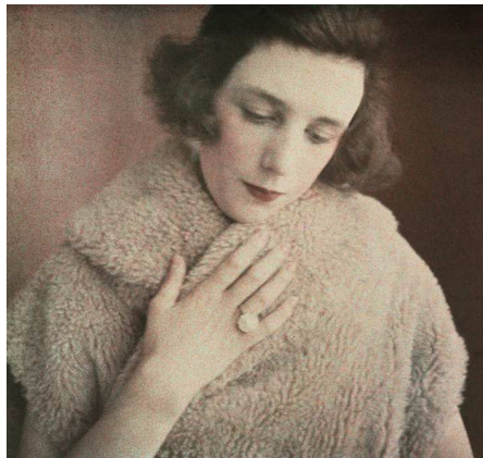
2) Bibi, Paris, Januar 1921 (S. 40)