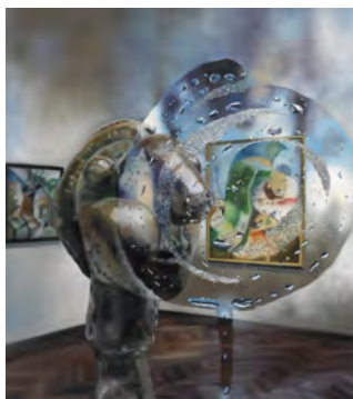
3.) Karin Kneffel, 2015 Öl auf Leinwand, 180 x 160 cm, Privatsammlung München