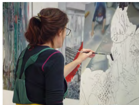
6.) Studio Karin Kneffel