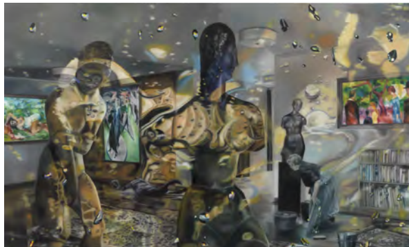
4.) Karin Kneffel, 2016 Öl auf Leinwand, 180 x 300 cm, Sammlung Timm Moll