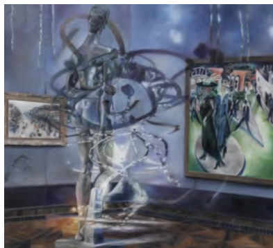
2.) Karin Kneffel, 2016 Öl auf Leinwand, 180 x 200 cm, Privatsammlung