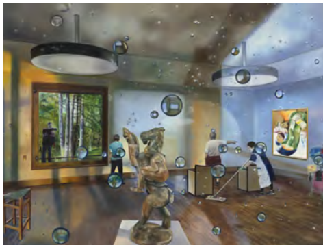
1.) Karin Kneffel, 2022 Öl auf Leinwand, 180 x 240 cm, Privatsammlung