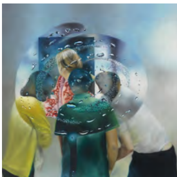
5.) Karin Kneffel, 2022 Öl auf Leinwand, 80 x 80 cm, Privatsammlung Zürich