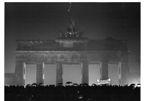
6) Öffnung des Brandenburger Tors, Berlin, 22. Dezember 1989