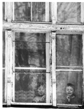
8) Kaliningrad, Rußland, 1993