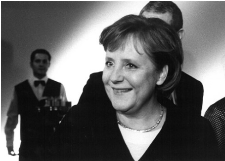
4) Angela Merkel, Frankfurt, 2008