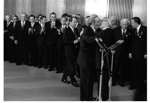
3) Leonid Breschnew, Erich Honecker, 30. Jahrestag der DDR, Ost-Berlin, 1979