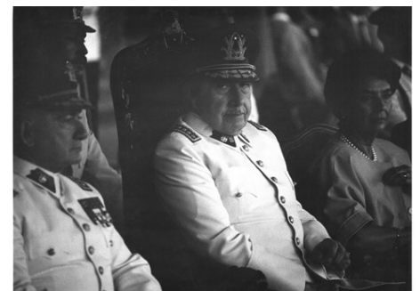
9) Augusto Pinochet, Santiago de Chile, 1986