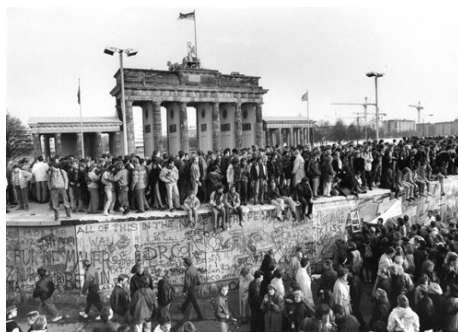
5) Fall der Mauer, Berlin, 10. November 1989