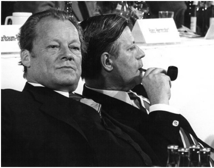
1) Willy Brandt, Helmut Schmidt, SPD-Parteitag Hannover, 1973