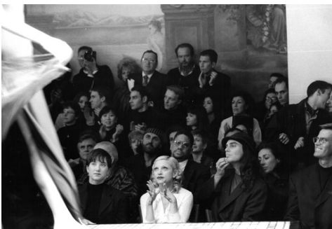
7) Haute Couture, Madonna, Paris, 1993