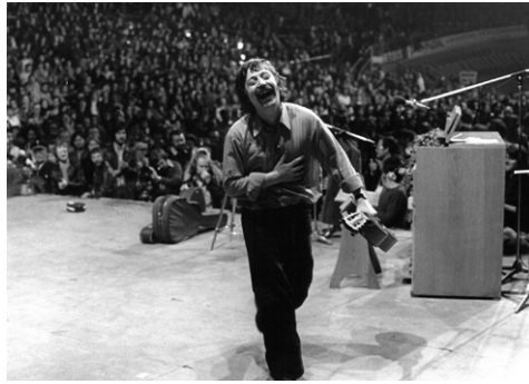
2) Wolf Biermann, Konzert vor der Ausbürgerung aus der DDR, Köln, 1976