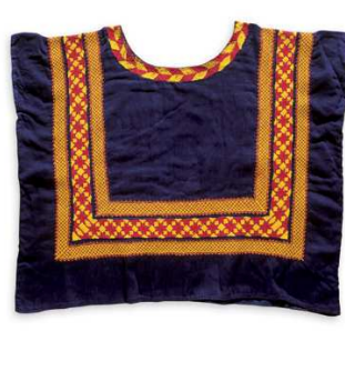
10) Mit der Kettenstichmaschine verzierter Baumwoll- huipil (Juchitán)