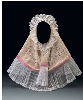
6) Resplandor aus Spitze, als Gesichts- huipil ( bida ni quichi ) getragen (Juchitán)