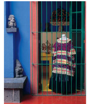
4) bestickter mazatekischer huipil aus Jalapa de Díaz (Oaxaca)