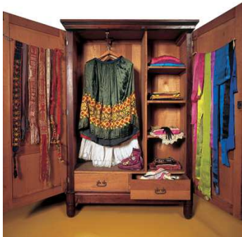
1) Schrank aus Diego Riveras Zimmer mit Fridas Kleidern