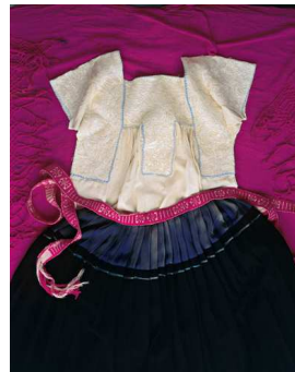
7) Bluse aus manta mit Weißstickerei (Chilac, Sierra Negra, Puebla), Purépecha-Bindegürtel, rollo einer verheirateten Purépecha mit applizierter Soutache (Santa Fe de la Laguna, Michoacán)