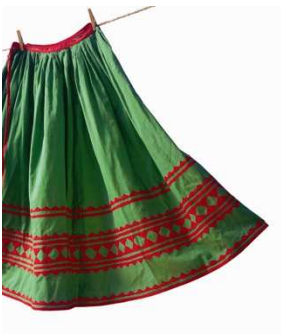
9) Rock mit Applikationen aus dem Amuzgo-Ort Xochistlahuaca (Guerrero)