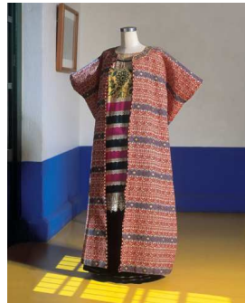
2) Mantel in falseria -Technik (Guatemala), Baumwoll- huipil mit angesetzten Bändern (Oaxaca)