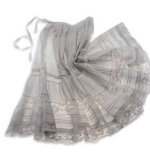
11) Baumwoll-Unterrock mit Bobinet-Spitze