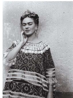
3) Frida, 1940