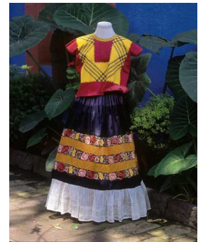
8) bestickter Seiden- huipil (Tehuantepec); Seidenrock mit angesetztem Spitzensaum aus Seide (ebenfalls Tehuantepec)