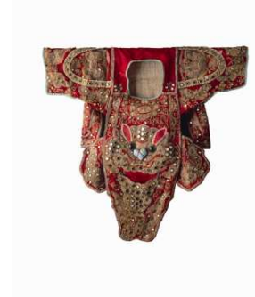
12) Chinesisches Seidenhemd mit aufgenähten Halbedel- und Spiegelsteinen, mit Silberfaden bestickt