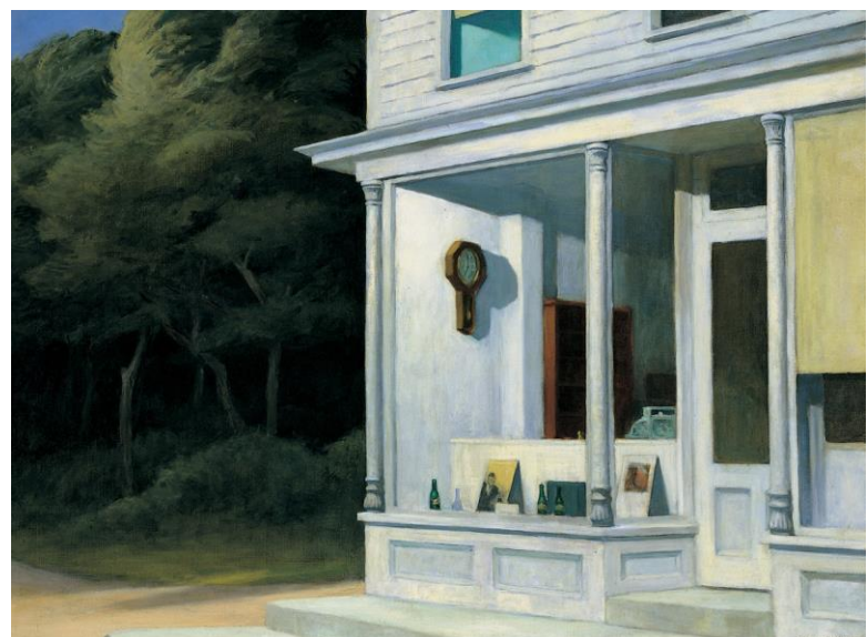
2) Seven A.M. , 1948 (76,2 x 101,6 cm) Whitney Museum of American Art, New York