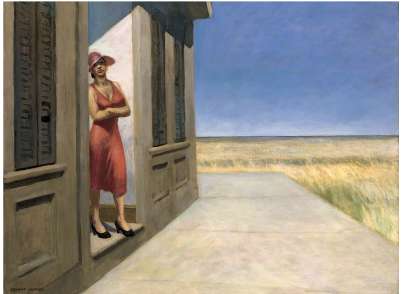
3) South Carolina Morning , 1955 (76,2 x 101,6 cm) Whitney Museum of American Art, New York