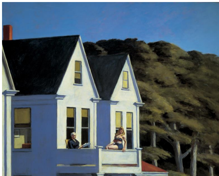
4) Second Story Sunlight , 1960 (101,6 x 127 cm) Whitney Museum of American Art, New York