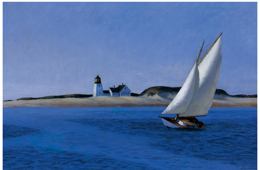
1) The Long Leg , 1935 (50,8 x 76,8 cm) The Henry E. Huntington Library and Art Gallery, San Marino, California; The Virginia Steel Scott Collection