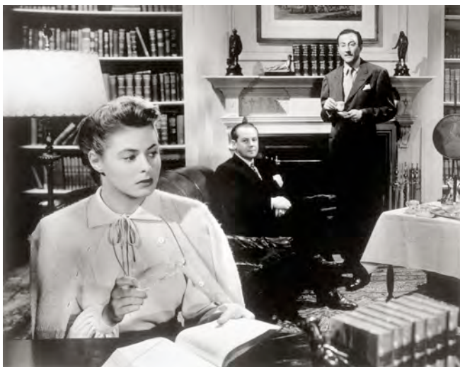
3) Ingrid Bergman. Szenenphoto aus Spellbound , 1944. (Seite 28)