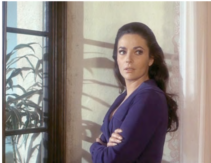
2) Karin Dor. Filmstill aus Topaz , 1969. (Seite 200)