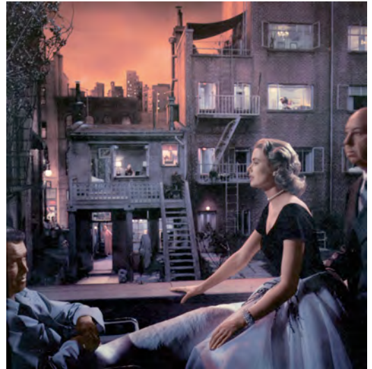
6) James Stewart, Grace Kelly und Alfred Hitchcock am Set von Rear Window , 1953. (Seite 59)