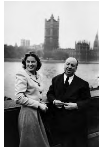
8) Ingrid Bergman und Alfred Hitchcock, London, 1948, (Seite 34)