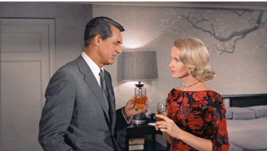
7) Eva Marie Saint. Filmstill mit Cary Grant aus North by Northwest , 1959. (Seite 131)