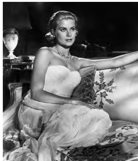
4) Grace Kelly. Filmstill aus To Catch a Thief , 1955. (Seite 61)