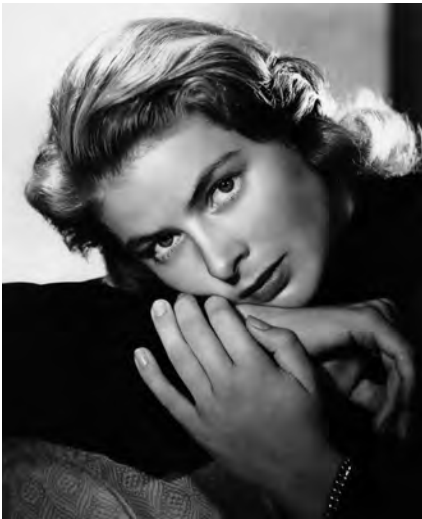
1) Ingrid Bergman. Publicity Shot für Notorious von Ernest Bachrach, Hollywood, 1945. (Seite 33)