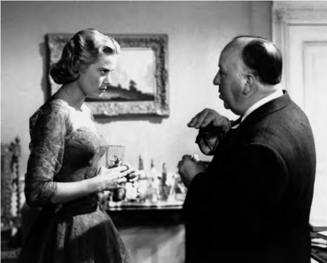
5) Grace Kelly und Alfred Hitchcock am Set von Dial M for Murder , 1954. (Seite 53)