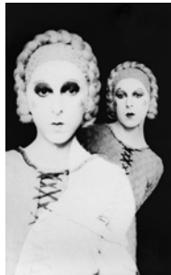
2.) Claude Cahun, Selbstportrait , 1929