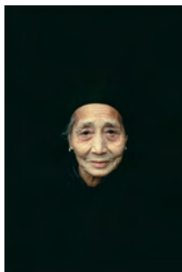
4.) Eve Arnold, Arbeiterin, China , 1979