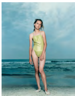
7.) Rineke Dijkstra, Mädchen am Strand , Kolobrzeg, Polen, 26. Juli 1992