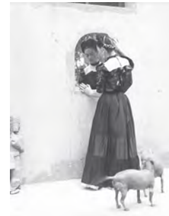
3.) Lola Alvarez Bravo, Frida Kahlo im Patio der Casa Azul mit ihren, Itz'quintli-Hunden , Mexico City, um 1944