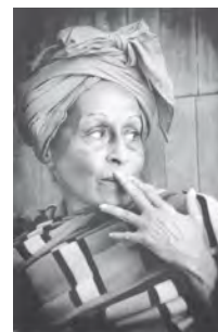
9.) Omara Portuondo, Havanna, 1998