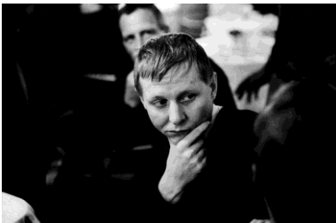
1) Hans Magnus Enzensberger bei der Tagung der Gruppe 47 im Hotel Kleber-Post in Bad Saulgau. Oktober 1963