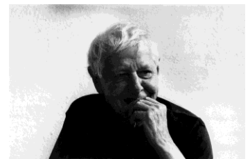
10) Hans Magnus Enzensberger, München 2009