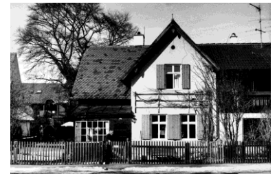
6) Das Elternhaus, Kaufbeuren 1998