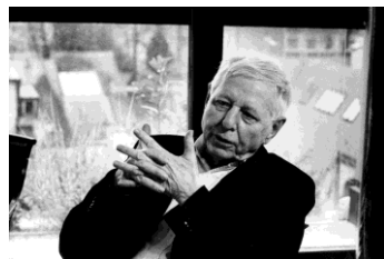
8) Hans Magnus Enzensberger in seiner Schwabinger Wohnung, Februar 2004