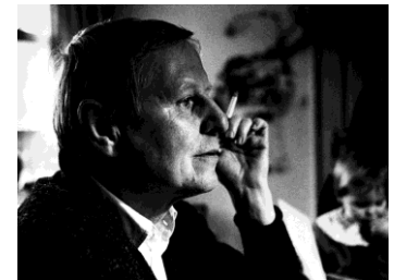
3) Hans Magnus Enzensberger, Kaufbeuren 1989