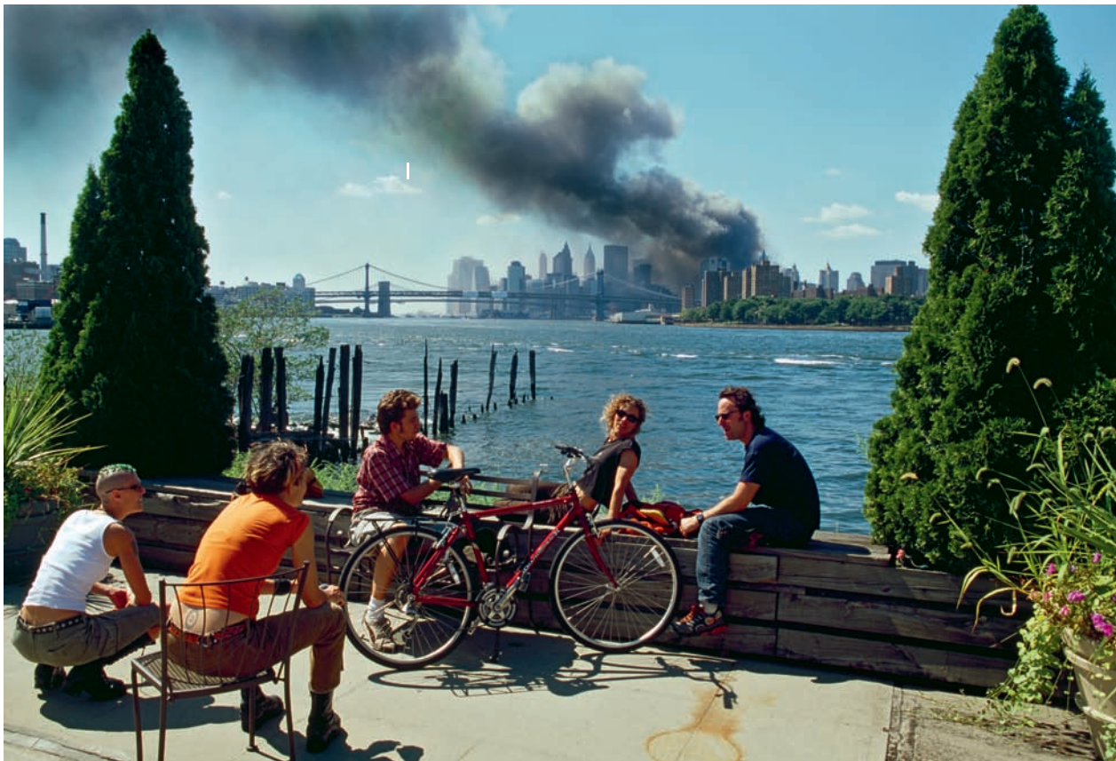
Blick von Williamsburg, Brooklyn, auf Manhattan, 11 September 2001

Thomas Hoepker Blick von Williamsburg, Brooklyn, auf Manhattan, 11. September 2001 Ein Bild und seine Geschichte Mit Texten von Michael Diers und Ulrich Pohlmann 64 Seiten, 10 Farbabbildungen ISBN 978-3-8296-0980-7 € 24,80 € (Ö) 25,50 CHF 28,50