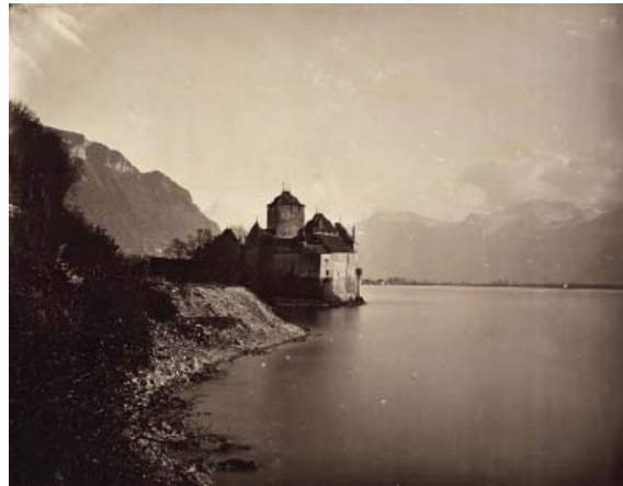
2) Adolphe Braun und Charles Braun: Schloss Chillon, um 1862 (Seite 142)