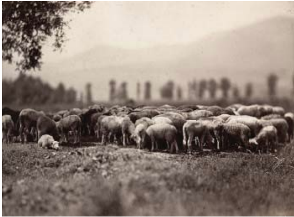
6) Adolphe Braun: Schafherde, 1860-62 (Seite 116-117)