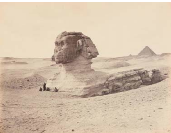
10) Gaston Braun und Amédée Mouilleron: Sphinx und Pyramiden von Gizah, 1869 (Seite 247)