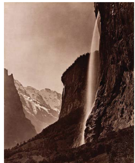
5) Adolphe Braun: Staubbachfall bei Lauterbrunnen, ca. 1875, Abzug um 1910 (Seite 151)