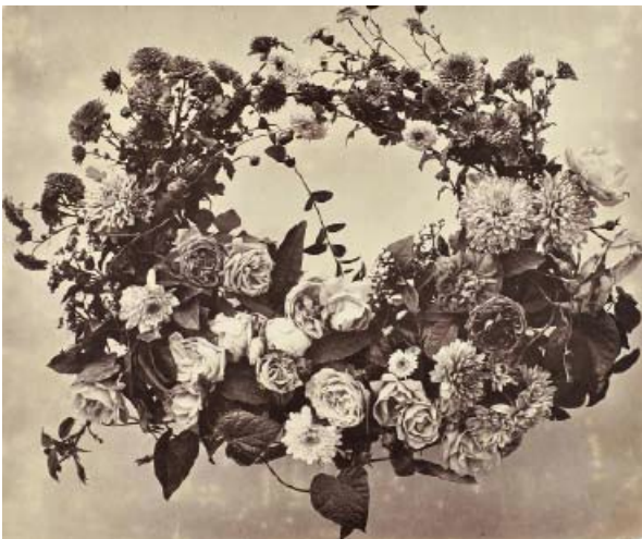
8) Adolphe Braun: Kranz mit Chrysanthenen und Rosen, um 1854 (Seite 35)