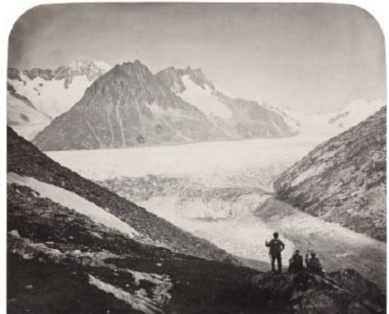
7) Adolphe Braun: Aletsch-Gletscher Kanton Wallis, um 1870 (Seite 167)