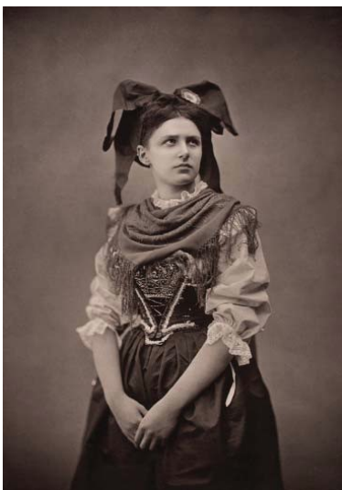
3) Adolphe Braun: Elsässerin, um 1871-72 (Seite 285)