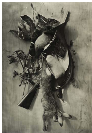
4) Adolphe Braun: Jagdstilleben mit Hase, 1867 (Seite 64)