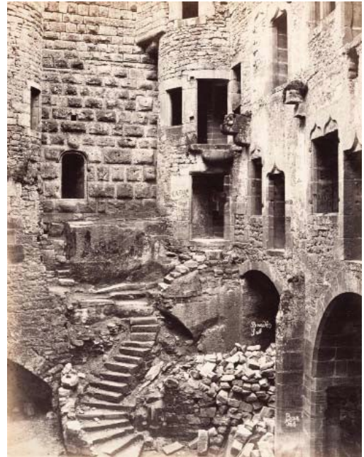
9) Adolphe Braun: Im Inneren von Hohkönigsburg, 1857-59 (Seite 89)