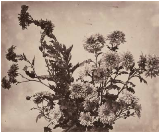
1) Adolphe Braun: Chrysanthemen, um 1855 (Seite 41)