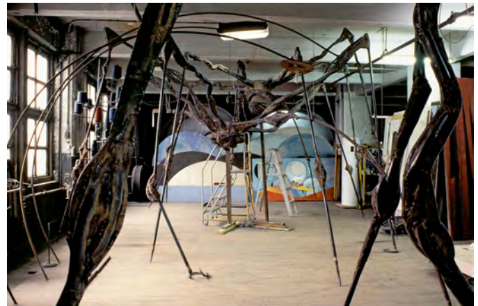
6) Die großen Spinnen, „Spider“ in ihrem Entstehungsprozess im Atelier in Brooklyn, 1995