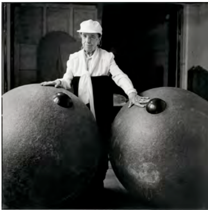
1) Louise Bourgeois im Atelier in Brooklyn mit ihrer Granitskulptur „Eyes“, 1995