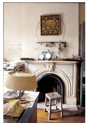
9) Das Büro in Chelsea, 1996

– Bitte beachten Sie unsere Nutzungsbedingungen auf der Rückseite –