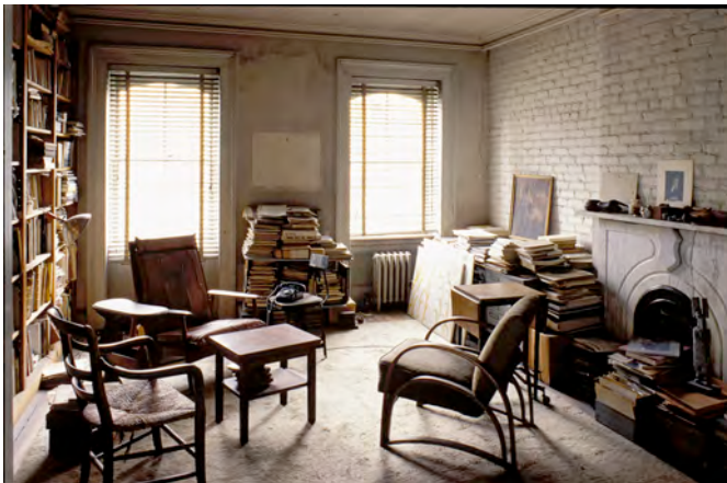
5) Die Bibliothek in der zweiten Etage des Hauses in Chelsea, 1996