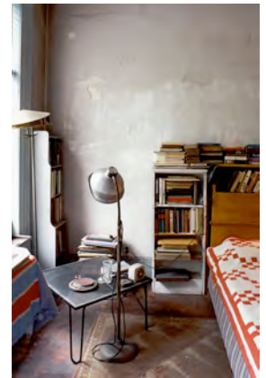
4) Das Schlafzimmer, das Bourgeois nach dem Tod des Ehemanns 1973 nicht mehr nutzte und abgeschlossen hatte, 1996