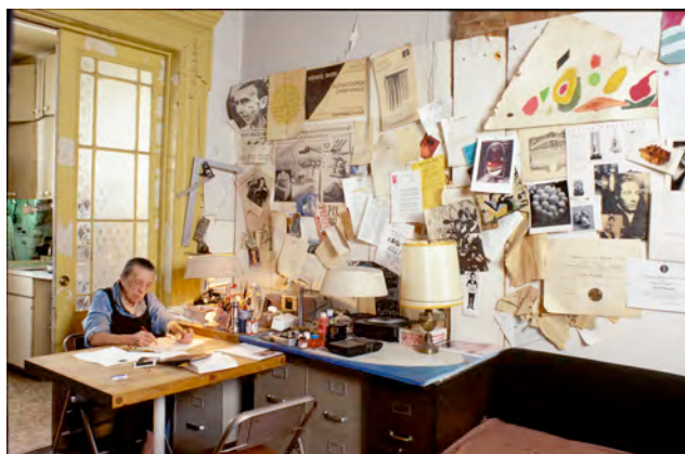
8) Louise Bourgeois an ihrem Arbeitstisch im „Wohnzimmer/Atelier/Büro/ Esszimmer“ des Hauses in Chelsea, 2000