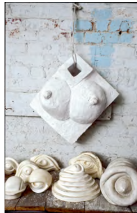
3) Skulptur im Haus in Chelsea