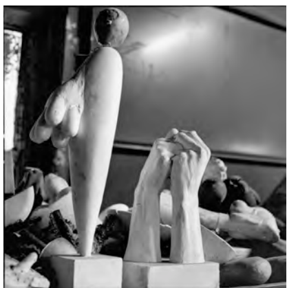
7) Skulpturen im Haus in Brooklyn