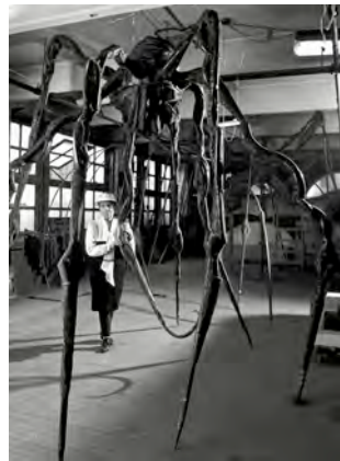
2) Louise Bourgeois im Atelier in Brooklyn mit der Skulptur „Spider“, 1995