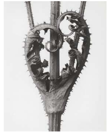
8) Dipsacus laciniatus , Schlitzblättrige Karde, Spross mit Blättern (Tafel 59)