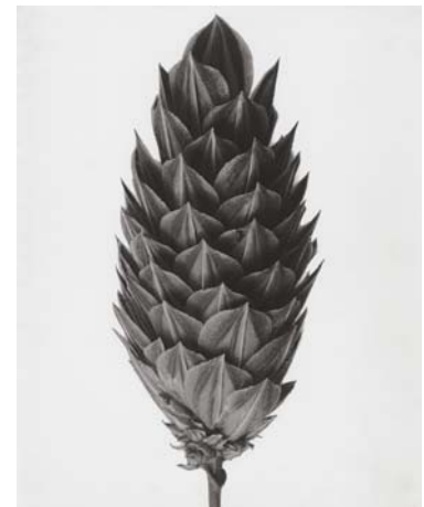
12) Allium oreophilum , Rosen-Zwerglauch, Blütendolde (Tafel 8)