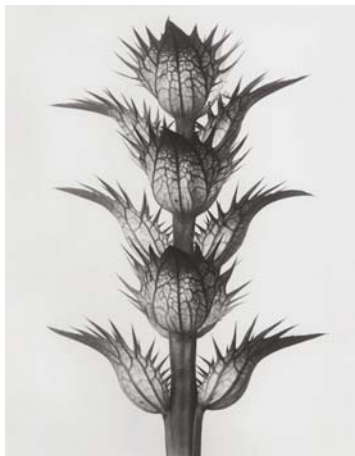
4) Acanthus mollis , Wahrer Bärenklau, Blütenstand mit Tragblättern, die Blüten sind entfernt (Tafel 19)