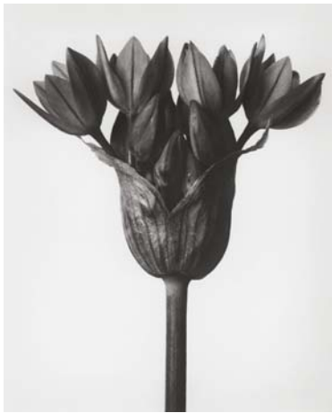
7) Allium oreophilum , Rosen-Zwerglauch, Blütendolde (Tafel 8)