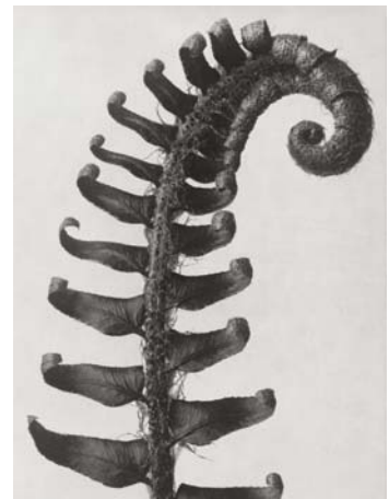
6) Polystichum munitum , Punktfarn, junger, eingerollter Wedel (Tafel 24)