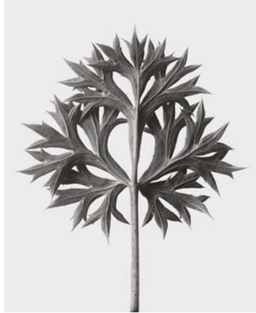
2) Eryngium bourgatii , Spanische Edeldistel oder Mannstreu, Blatt (Tafel 27)