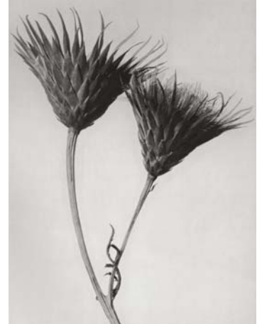
3) Serratula nudicaulis , Nacktstängelige Scharte, Fruchtköpfchen (Tafel 14)