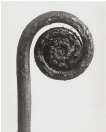
10) Adiantum pedatum , Haarfarn, junger Wedel (Tafel 44)