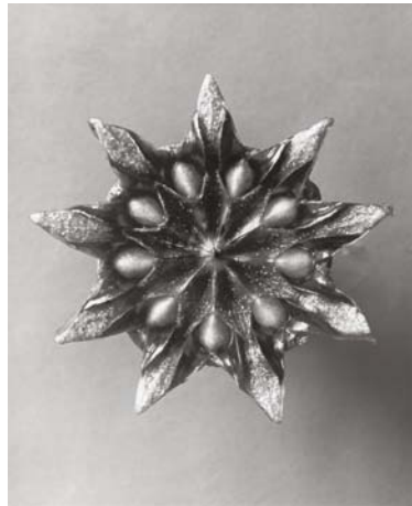
8) Mesembryanthemum linguiforme , Eispflanze, Samenkapsel (Tafel 12)