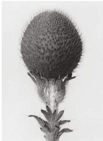
1) Papaver orientale , Türkenmohn, Blütenknospe (Tafel 1)