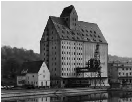
4.) Bernd und Hilla Becher, Speicherbaus, Passau, Deutschland , 1988