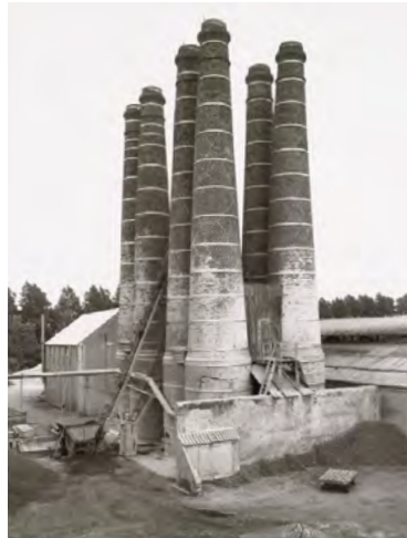
2.) Bernd und Hilla Becher, Kalkofen/Lime Kiln, Brielle, Niederlande , 1968