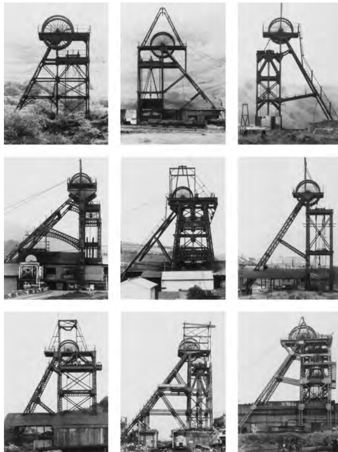
8.) Bernd und Hilla Becher, Typologie, Fördertürme/ Winding Towers , 1966–97