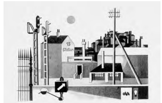
6.) Bernd Becher, Train Station on the Edge of Town , Lithographic 1954