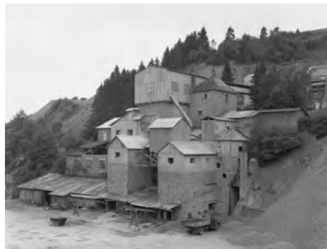
5.) Bernd und Hilla Becher, Kieswerk, Finnentrop, Sauerland, Deutschland , 1962