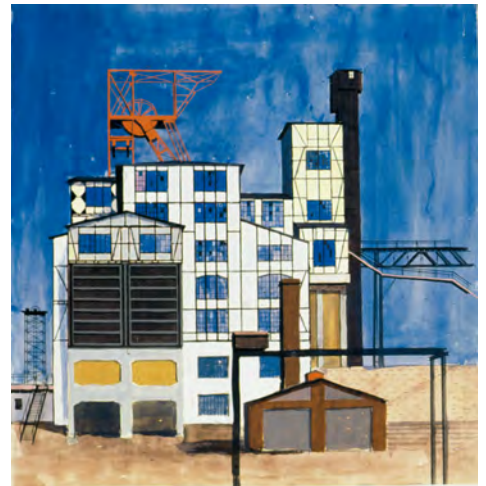
3.) Bernd Becher, Eisenhardter Tiefbau Mine, Eisern, Germany , Aquarell, 1955–56