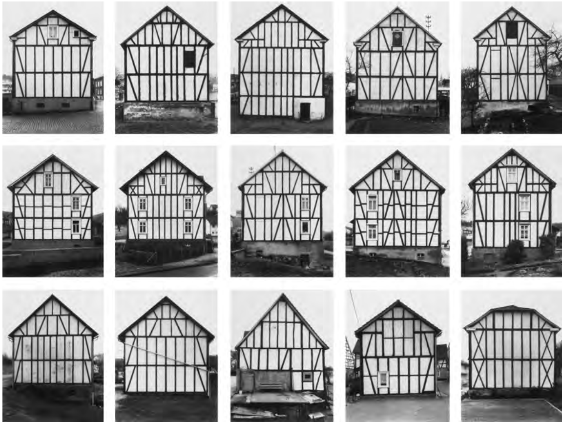
7.) Bernd und Hilla Becher, Typologie, Fachwerkhäuser/ Framework Houses , 1959–72