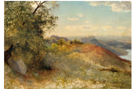
6.) Blick zum Castel Gandolfo, 1869, S. 77