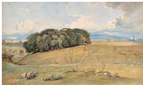
8.) Hain der Egeria bei Rom, 1869, S. 105