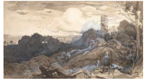
3.) Landschaft mit Ruine und Staffage, 1866/69, S. 54