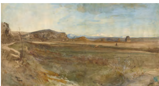
7.) Campagna, Landschaft von der Via Flaminia gesehen, 1869, S. 79