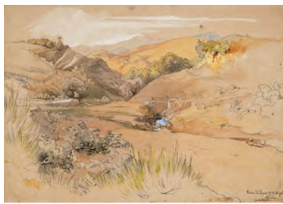
2.) Rocca di Papa, 1865, S. 51