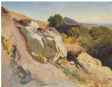
1.) Landschaft bei Kamaik, 1865, S. 14

geb. Buchhandelsausgabe € 44,- €(Ö) 45,30 CHF 50,60