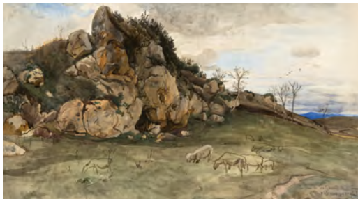
4.) Felspartie an der Molle-Brücke, 1867, S. 100