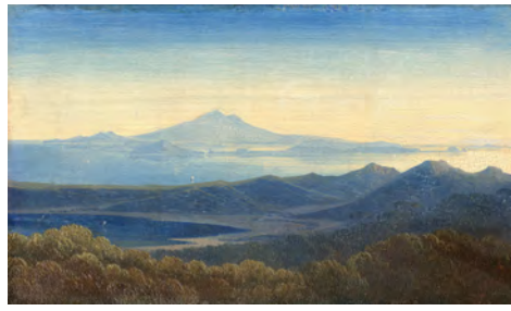
5.) Golf von Neapel, um 1867/69, S. 74/75